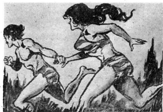
— Πᾶμε τώρα νὰ παρακολουθήσουμε τ' ἀχνάρια τῶν ποδαριῶν τῆς ἀρκούδας πού εἶδα χθὲς τὴ νύχτα. λέει ὁ Ζαντόβ στὴν ὁμορφὴ κοπέλλα.

Ὁ Ζαντόβ δίνει τώρα στὸν Κακαράκ τὸ καθούκι τῆς καρύδας μὲ τὴν κόλλα: