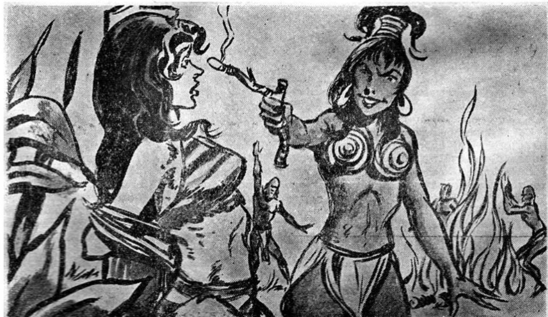
‘Η φοδερὴ μαύρη βασίλισσα ἀρπάζει ἀπὸ τὴ φωτιά ἕνα κλαδί πυρῶμένο στὴν ἄκρη του. Πλησιάζει τὴν δεμένη Ζάμπα γιὰ νά τῆς κάψη τὰ μάτια.

Καί νά: Κατὰ τὰ μεσάνυχτα μιὰ ἄγρια φωνὴ τοὺς κάνει ν’ ἀνασπκωθοῦν ξαφνιασμένοι κι’ ἀνήσυχτοι στὰ στρωσιδία τους. ‘Ἀμέσως: ὁ τρόμος καί ἡ φρίκη ζωγραφί-