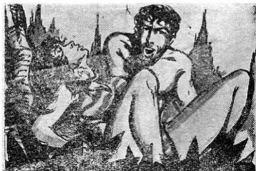
Ο Σωσίας γονατισμένος πλάι στη Ζάμπα, κάνει τὸ ίδιο γιατροσόφι που πριν λίγο ο Μπούχ και ή Κράν είχαν κάνει στὸν Ζαντόβ.