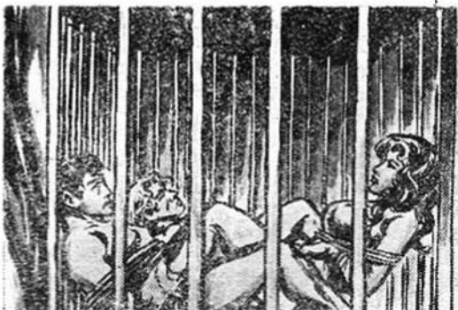
Ὁ κακούργος τυχεδιώκτης Ρομπέρ προστάζει τὸν φύλαρχο νὰ κλείσῃ τὸν Ταρζάν, τὴ Ζάμπα καὶ τὸν Ζαντόβ κάτω στὸ σιδερένιο κλουβὶ.

— Ζαντόβ!, κάνει στὸ σωσία. Βρῆκα ἓ- ναν τρόπο νὰ σώσω κί... «ἔσένα» καὶ τὸν Ζαντόβ καὶ τὴ Ζάμπα ποὺ αὐτὴ τὴ στιγμή βρισκόσαστε μέσα στὸ σιδερένιο κλουβὶ