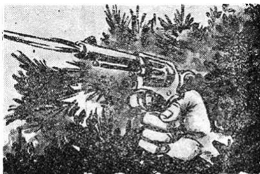
Ξαφνικά έξη πυροβολισμοί άντηχούν. Οί σφαίρες αλλοίμονο βρίσκουν πάνω στους δυό προϊστορικούς ανθρώπους. Τόν Μπούχ και τήν Κράν.

Η πῶσι αυτή βέβαια είναι άργή και ό σωσίας δέν παθαίνει κανένα κακό. Όμως κολουφλαρισμένος κάτω από τὸ πυκνὸ φύλλωμα τού πεομένου δέντρου καταφέρνει