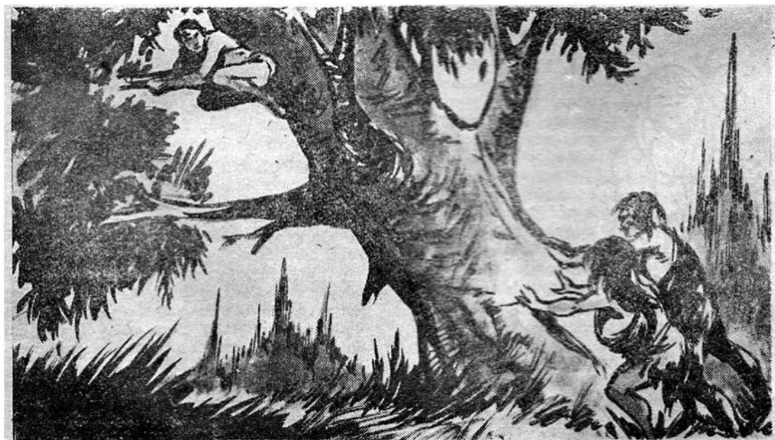
Οἱ δύο προϊστορικοὶ ἄνθρωποι, μὲ τὴν καταπληκτικὴ δύναμή τους, σπρώχνουν καὶ γκρεμίζουν κάτω τὸ γιγάντιο αἰώνιο δέντρο.