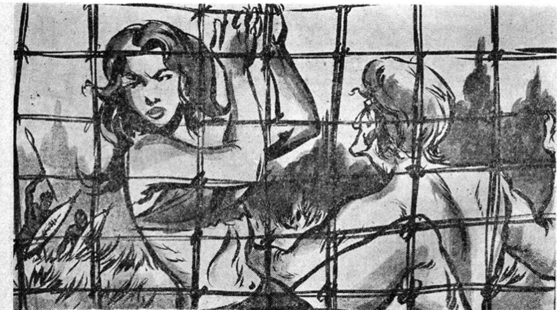
Σαφνικὰ, μέσα στὸ σκοτάδι τῆς νύχτας ποῦ τρέχουν νοιώθουν νὰ πέφτουν καὶ νὰ πιάνωνται σὲ μιὰ πολὺ τραγικὴ παγίδα.

Κάθε πυρωμένο βλήμα ποῦ ξερνάει ἡ θανατερὴ κάννη τῆς σωριάζει κάτω κι' ἔ-