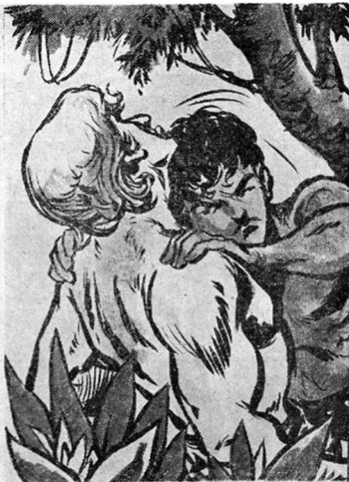
Ὁ Ζαντόβ, ἐξαγριωμένος τώρα ἀρπάζει τὸν Ταρζάν ἀπὸ τοὺς ὤμους. Τοῦ δίνει μιὰ τρομακτικὴ κουτουλιά στὸ πρόσωπο...!

Ὅμως ὁ σεισμὸς πού ἔκανε τὸν Κακαράκ νὰ γκρεμισθῆ πάλι κάτω, ἀνοιξε κι' ἄλλὰ παρακλάδια στὴ ρωγμὴ αὐτὴ τοῦ ἐδά-