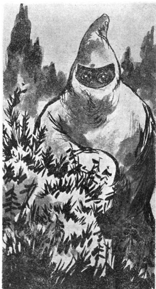
Και νά: Ξαφνικά πίσω άπό κάποιον πυκνό θάμνο ένα τρομακτικό άνθρώπινο πλάσμα παρουσιάζεται!...

Μά νά: Ξαφνικά άντικρύζουν, σέ κάποια άπόσταση μπροστά τους, δυό λευκούς άνδρες κι' έναν μαύρο νά παλεύουν. Και κοντά τους, πεσμένους κάτω, άλλους δυό λευκούς. Ήταν ό Ζαντόβ πού πάλευε μέ τόν Χουάιτ και τόν Μπλάκ. Και κοντά τους πεσμένοι κάτω: ό Ταρζάν και ή Ζάμπα.