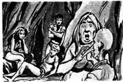
'Ο Ταρζάν, ή Ζάμπα, ή Ζαντόβ, ή Κακαράκ και ή Τσιχλ περιμένουν άνυπόμονοι έξω από τή σπηλιά. Μέσα σ' αυτήν ή Χουρουντουμπούν ήγχειρίζει τὸ «Τέρας τού Πολιτισμού».

«Χουρουντουμπούν» είναι τό... καϊδευτικό του. Ξεκουτιασμένος άνθρωπος είναι: τὰ μερδεῦει.