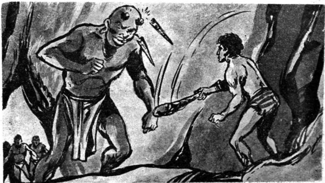
Ὁ ὑπέροχος «Ἕλληνας» κτυπάει ξαφνικὰ μὲ τὸ φοβερὸ του ρόπαλο τὸν μαῦρο ὑπεργίγαντα Χάμπα - Χούμ. Καὶ τὰ μεγάλα σουβλερά του κέρατα σπάζουν.

Ὅμως ἀφάνταστα σβέλτος ὁ Ταρζάν κινεῖται ἀκαριαία πρὸς τὰ δεξιά. Κι' ἐνῶ τὸ μαχαίρι τοῦ δολοφόνου τὸν δρίσκει ξώφαλτα στὸν ὦμο, κάνει κάτι ὑπεράνθρωπο: Σκύβει ἀπότομα. Ἀρπάζει τὸν Ράχ Ἄμπτούν ἀπὸ τὰ καλάμια τῶν ποδαριῶν του. Ξανασπκώνεται. Κι' ἐνῶ ἐκεῖνος πέφτει ἀνάσκελα ὁ Ταρζάν ἀρχίζει νὰ περι-