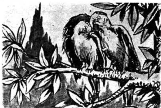
“Ο Κουσκούς, ο τετραπέρατος κι’ άχώριστος παπαγάλος του Κακαράκ, είναι ξετρελλαμένος με τή Λαλίττα: τήν όμορφη παπαγαλίνα τής βασίλισσας Βούρχα - Λάγκα.

Στό ελάχιστο αυτό χρονικό διάστημα: από τή στιγμή πού έπεσε μέχρι να ξανασηκωθή, τό πόστο πού κρατούσε έμεινε άκόλυπτο. Και οί καννίβαλοι βρήκαν τήν ευκαιρία: Μερικοί από αυτούς κατάφεραν να περάσουν μέσα στη σπηλιά. “Ετσι ο άγώνας τών δυό ήρώων μας γίνεται τώρα διμέτωπος. Είναι υποχρεωμένοι να κτυπάνε τούς άνθρωποφάγους πού όρμάνε από μπροστά τους. Και τούς άλλους πού κάμουν επίθεσι από πίσω τους.