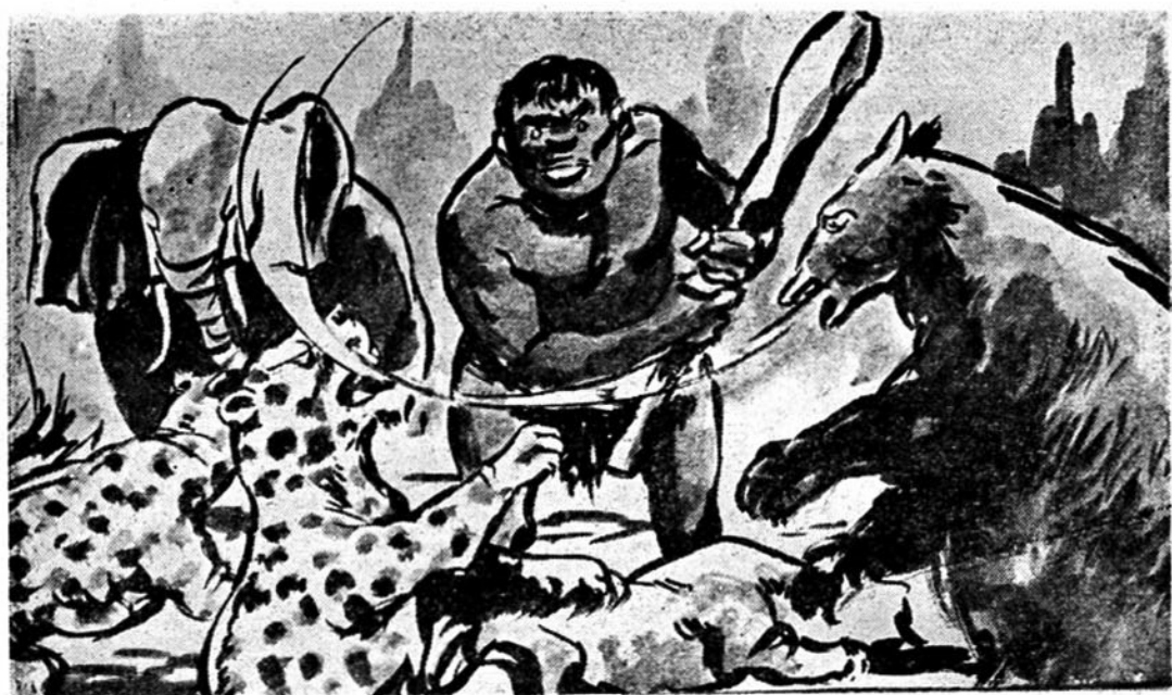
Ὁ τυφλὸς Μπαχούρ ἀνεβοκατεβάζει τὸ τρομακτικὸ του ρόπαλο. Κτυπάει στὰ στραβά τὰ μανιασμένα βεριά πού του ἔχουν ἐπιτεθῆ.

ως. Καὶ συνεχίζοντας νὰ βαδίζη, γυρίζει τὴν κἀννη τῆς πρὸς τὸν ἄρχοντα τῆς Ζούγκλας πὺ προχωρεῖ ἀνύποπτος. Φέρνει τὸ δάκτυλό του, πὺ τρέμει, στὴ σκανδάλη.