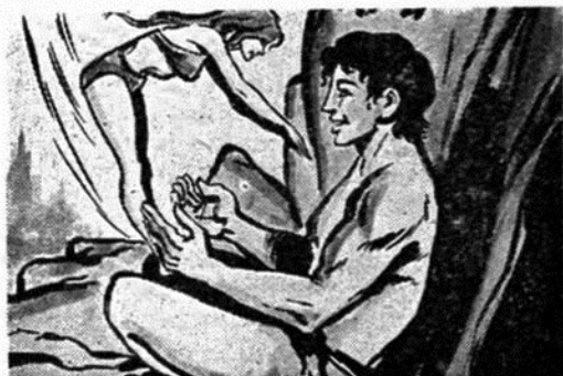
“Ο δυναμικός “Έλληνας Ζαντόβ, ό «Σκληρός άντρας» τής Ζούγκλας, καθισμένος έξω από τή σπηλιά του παίζει γυμνάζοντας τήν μικροσκοπική και χαριτωμένη Τσίχλα.