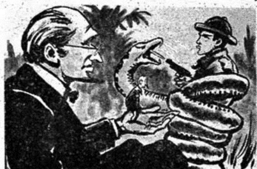
Τρομοκρατημένος ὁ δειλὸς Ρούγκο πυροβολεῖ μὲ τὸ πιστόλι του τὸ κεφάλι τοῦ τεράστιου βόα πὺθ ἔχει ἐπιτεθῆ...