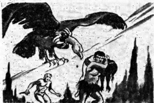
Ὁ ὑπέροχος Ταρζάν τρέχει, μὲ τὸ μαχαίρι του, νὰ κἀνὴ τὴν πιὸ ἐπικίνδυνη ἐπίθεσι τῆς ζωῆς του. Ὁ φοβερός μαύρος κτηνάνθρωπος....

Καὶ λέγοντας αὐτὰ, τὸ βάζει στὰ πόδια. Ξαναγυρίζει μὲ κατεύθυνσι πρὸς τὸ ξέφωτο. Ἐκεῖ πού εἶχε ἀφήσει τὸν τρελλὸ καθηγητὴ νὰ μιλήσῃ στὸ μικρόφωνο τοῦ ἀσυρμάτου τηλεφώνου του.