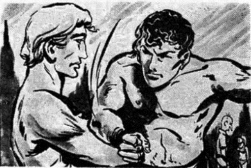
Ξαφνικά κι' άπότομα ό «Σκληρός άντρας» δίνει μία τρομακτική γροθιά στο πρόσωπο τού Ταρζάν. Όμως ό άρχοντας τής Ζούγκλας...

— Πήγαινε να π'ης σ' αυτόν τόν Ζαντόβ, τó φίλο σου, πώς θα τόν περιμένω άπόψε έξω από τή σπηλιά μου. Όμως καλά θα κάνη να μην έλθη, Έκτός αν θέλη να χορ-