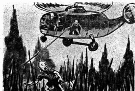
— Ὁ ἀνισόρροπος Γερμανὸς καθηγητὴς ἀδειάζει ὅλες τὶς σφαῖρες τοῦ πιστολιοῦ στὸν κλέφτη τῆς πολυτίμης βαλίτσας του.

— Ὁ σουβλερομύτης ψιθυρίζει συγκινημένος: