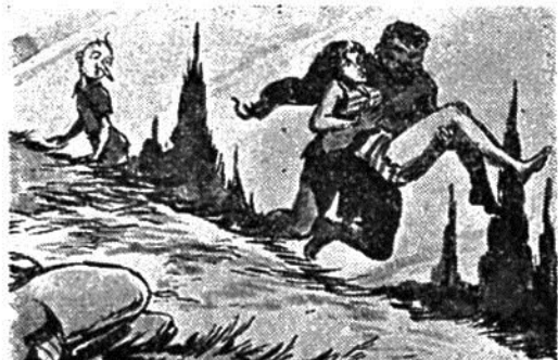
Καὶ ὁ φοβερὸς Μπαχούρ, οὐρλιάζοντας θριαμβευτικά τρέχει πρὸς τὴ βαθειὰ χαράδρα πού βρισκεται ἡ φρικτὴ σπηλιὰ του.

Ὑστερα ἀπὸ λίγο, παρατώντας τὴ μικρὴ κελῶνα, ξεκινάει ἀργά. Προχωρεῖ πάλι