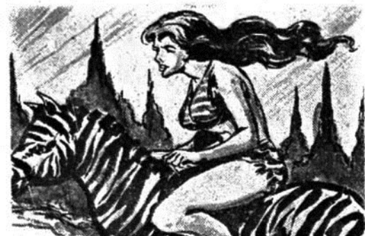
Σὰν ἀστραπὴ ἡ ὑπέροχη ἀμαζόνα Ζάμπα κολλᾷ ζεὶ πάνω στὸν ὀμορφο καὶ γρήγορο ζέβρο της.

Καὶ τὸ κόλπο τοῦ «Παλάτσου μὲ τὴ σουβλερὴ μύτη» πιάνει. Ἀπὸ τὴ θαλαμηγοῦ τοῦ ἀποκρίνονται: