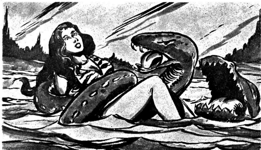
"Ένας πεινασμένος κροκόδειλος πλησιάζει άθόρυβα τήν τεράστια νεροφίδα πού έχει άρπάξει τήν όμορφη Ζάμπα. Και άνοιγοντας τά τρομακτικά σαγόνια του...