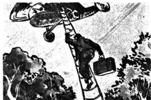
Ἐνας νέος ἄνδρας κατεβαίνει σβέλτος ἀπὸ τὴν κρεμασμένη σκάλα τοῦ ἐλικοπτήρου. Στὸ χέρι του κρατᾶει μιὰ μεγάλη μαύρη βαλίτσα.

βρήκες νᾶρθης φουκαρά μου;! Σάν... ἀσπρίνη θὰ διαλυθῆς στὸ νερό! Χά, χά, χά! Ἐκεῖνος, ἀκούγοντας τὴ φωνή του σταματάει. Σκῶνει τὸ κεφάλι πρὸς τὰ κλαδιά τοῦ αἰωνόβιου δέντρου. Ρωτᾶει ἀδιάφορα: