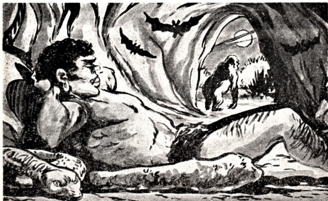
Ό μαύρος γίγαντας Μπαχούρ ζή σε μία σπηλιά γεμάτη φίδια, σκορπιούς και σαρκοφάγες νυχτερίδες

Αυτό ήτανε! Σχεδόν άμέσως οί άμέτρητοι πίθηκοι πού είχε είδοποιήσει ή Μίμ, ή τετραπέρατη μαϊμουδίτσα του "Άρχοντα