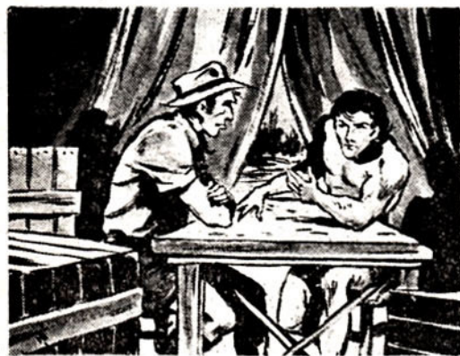
Και ο Ρούγκο με τον άρχηγό των λευκών κυνηγών, κλείνουν γρήγορα την «έντιμη» συμφωνία.

Μά ο καλόκαρδος Μπαχούρ έχει, αλλοίμονο, και αλλόκοτη αδυναμία. Κάθε φορά που αντικρύζει την όμορφη Ζάμπα, αγριεύει αφάνταστα! Την κυνηγάει σαν τρελλός. Και όταν καταφέρει να τη φθάσει, καβαλλάρισσα στο ζέβρο της, την αρπάζει και τη φέρνει χαρούμενος στο τρομακτικό βάραθρο που ζή. “Εκεί της προσφέ-