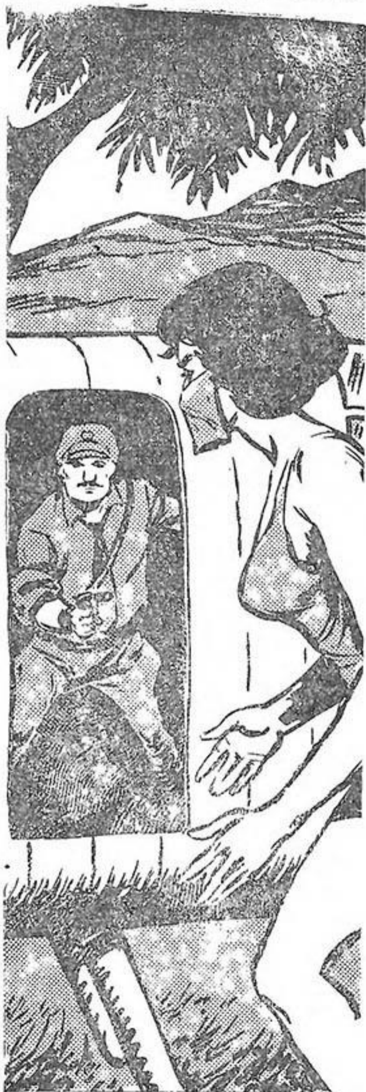
Βλέπει ἄξαφνα μπροστὰ τῆς τὸν Περὲθ!...

Τὸ μόνο πὸν ἤλπιζε ἦταν νὰ μείνουν ὡς τὸ τέλος μαζί, ὥστε ὅταν περάσῃ ἡ θύελλα καὶ ἡ Νάγια μὲ τὸν κα-