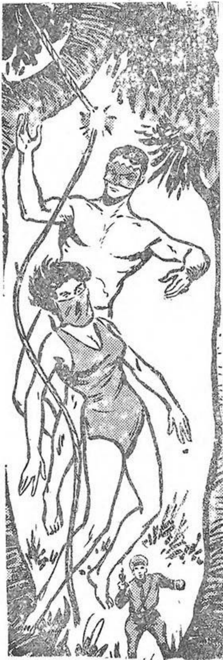
Η σφαίρα βρίσκει το φυτικό σχοινί...