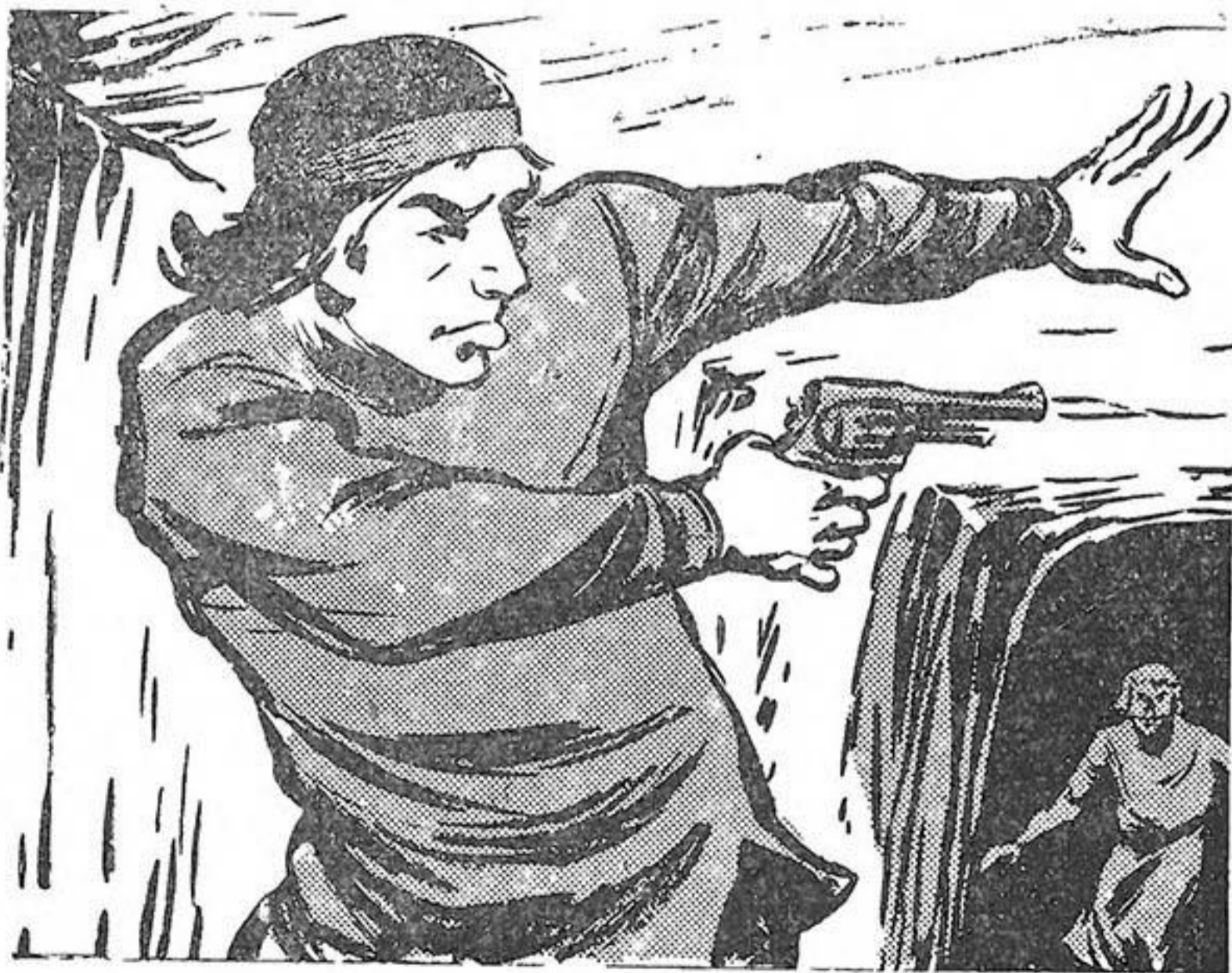
Ρίχνει τρείς άπανωτούς πυροβολισμούς στο σωρό...