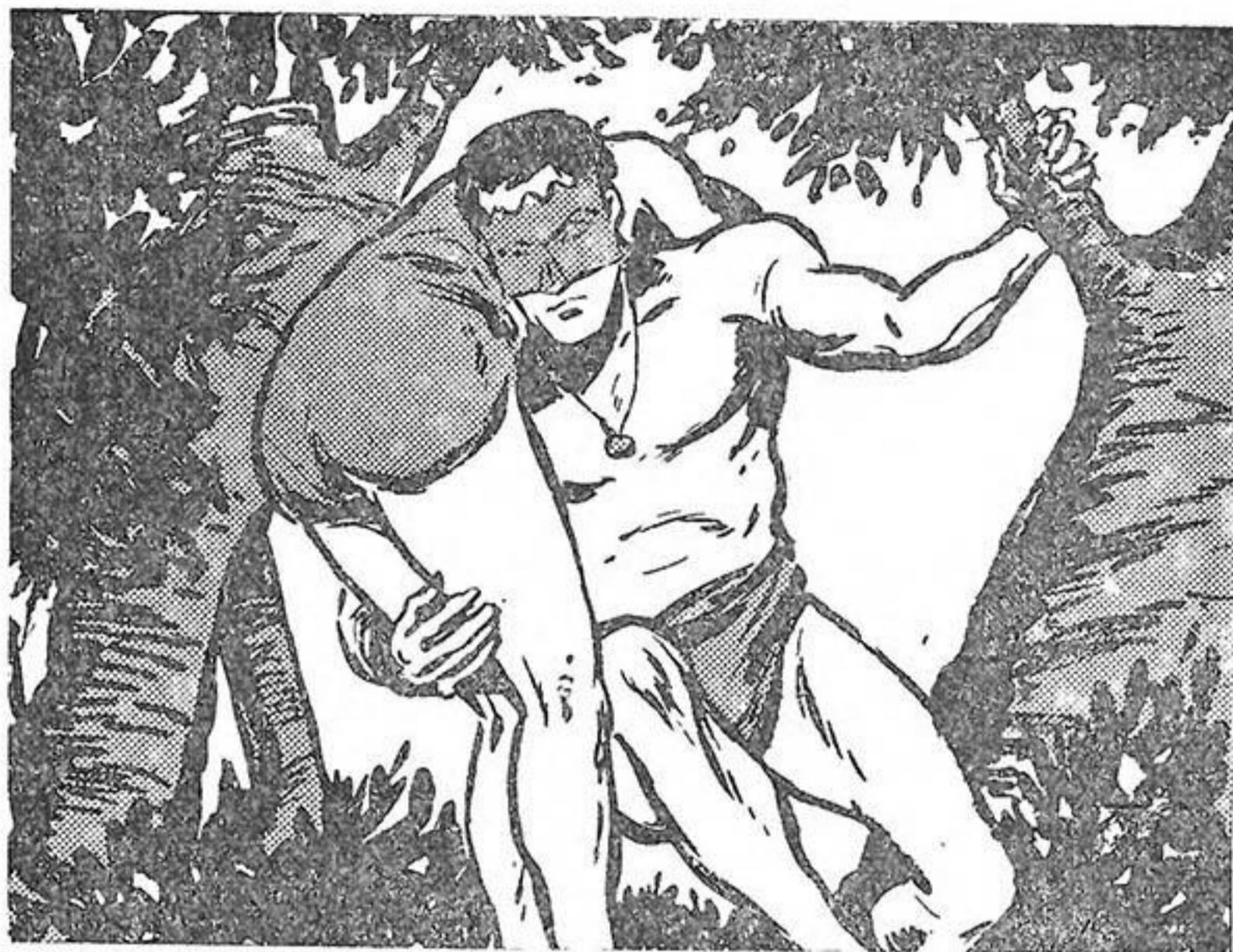
Πηδούν έτσι από δέντρο σὲ δέντρο.