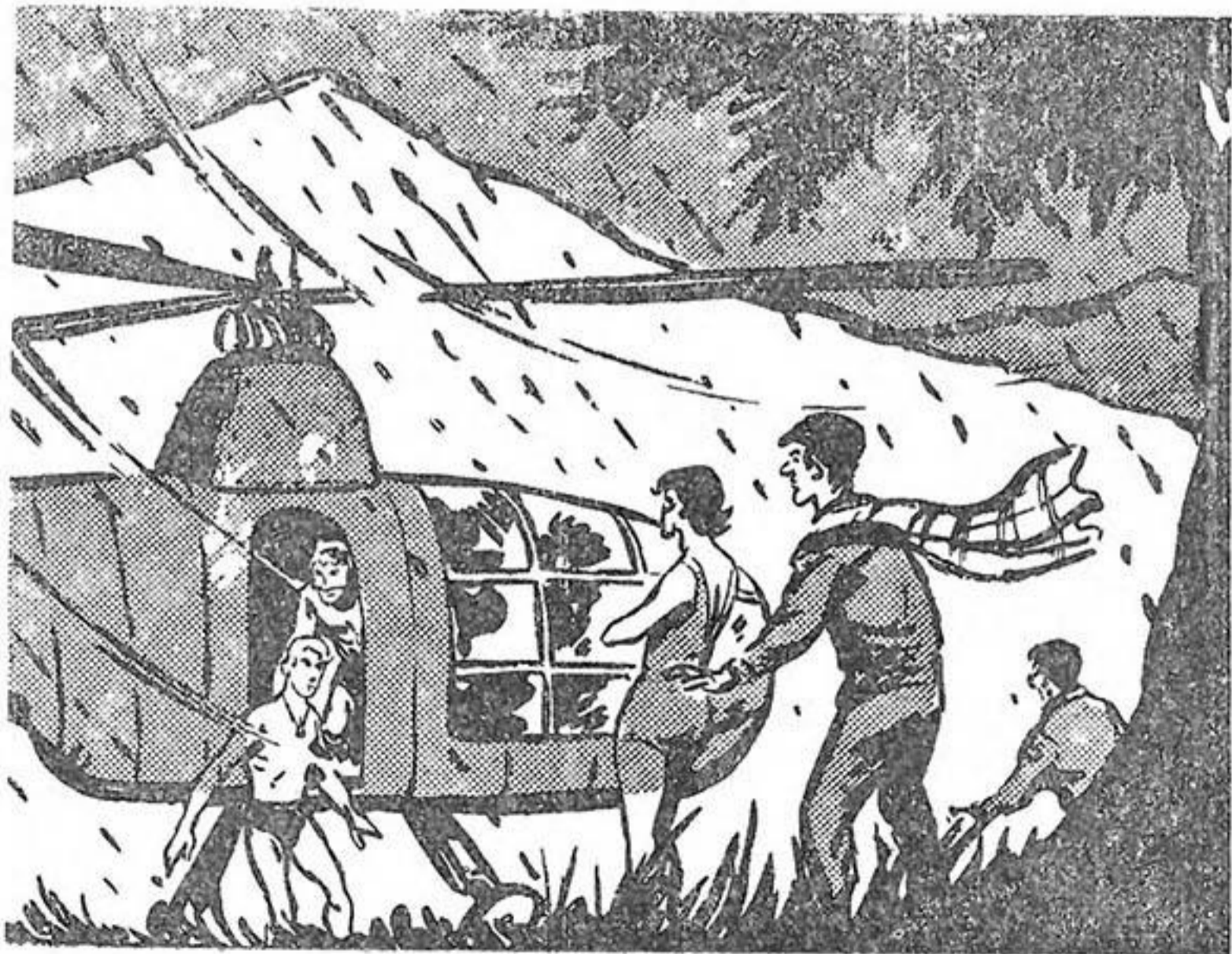
Ἄρχίζουν να κατεβαίνουν.