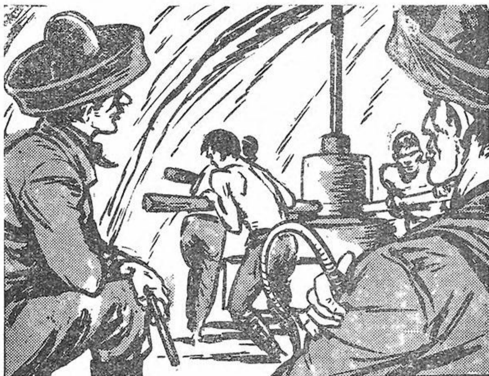
‘Ο Ζορρό αντίκρουσε μιὰ σκηνή κολάσεως

λικόπτερο ύψώνεται καιτακόρυφα και μαλακά και χάνεται μέσα στον ουρανό.