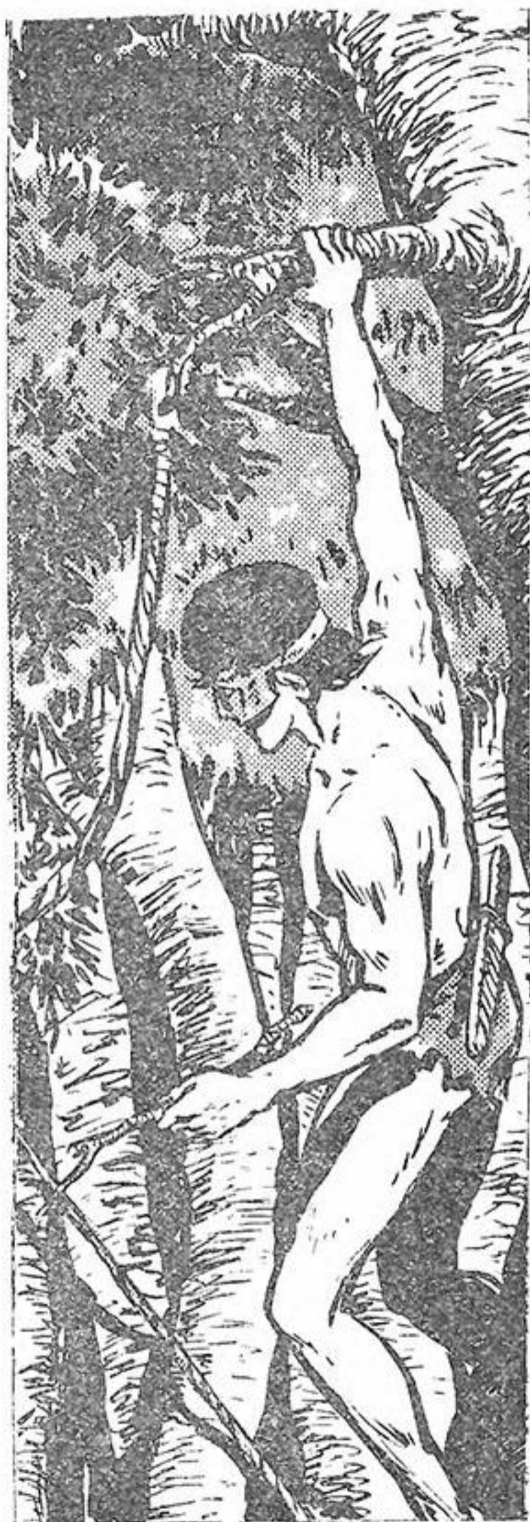
Ὁ Ζορρὸ ἄγγιξε τὸ σχοινὶ ἐλαφρὰ μὲ ἓνα κλαδί.

Κινεῖται γοργά. Ἀρπάζεται ἀπὸ ἓνα κλαδί, ποὺ κρέμεται πάνω ἀπὸ τὸ τεντωμέ-