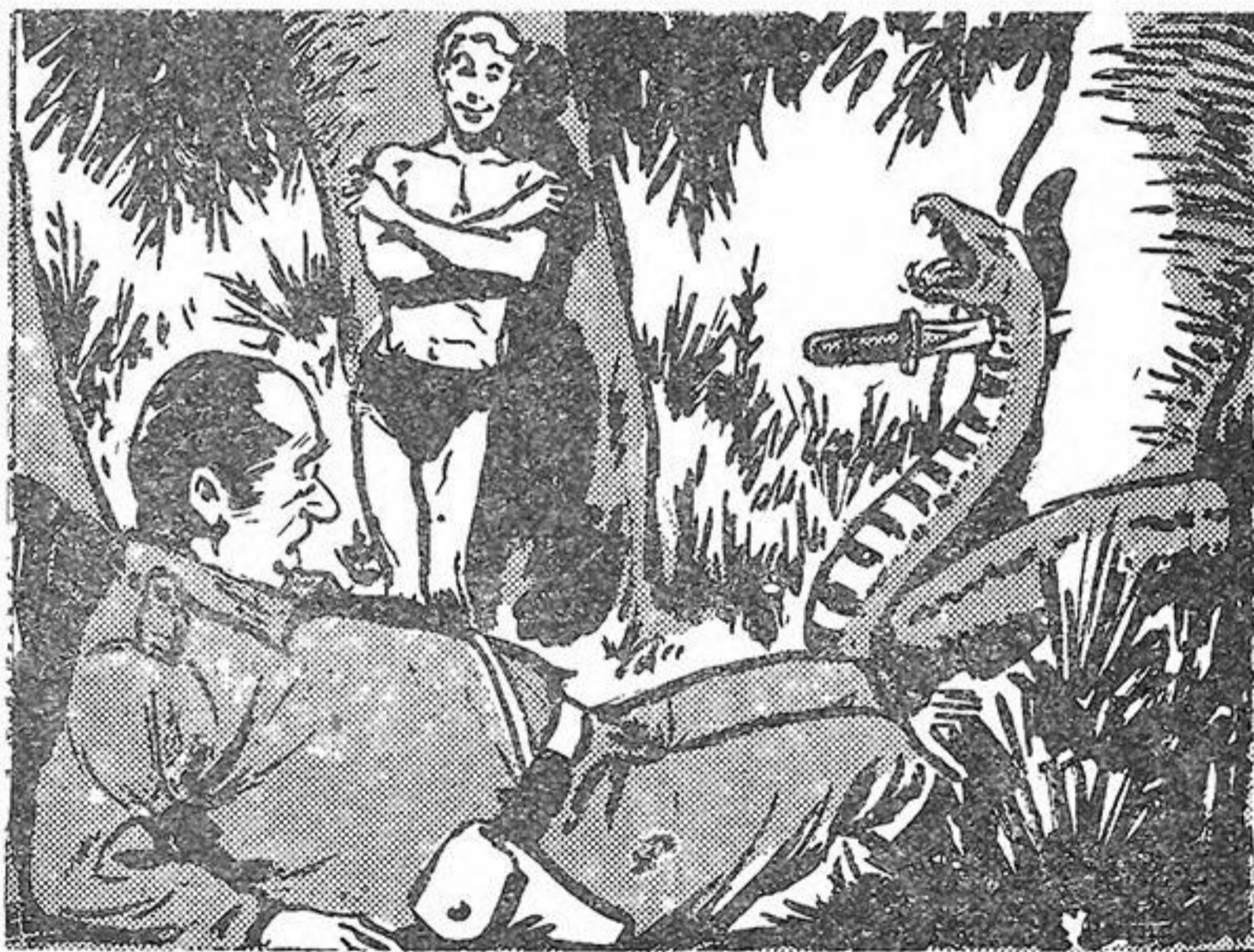
'Ο Έλ Ρέϋ, ψιθυρίζει κατάπληκτος, ό διοικητής της άστυνομίας