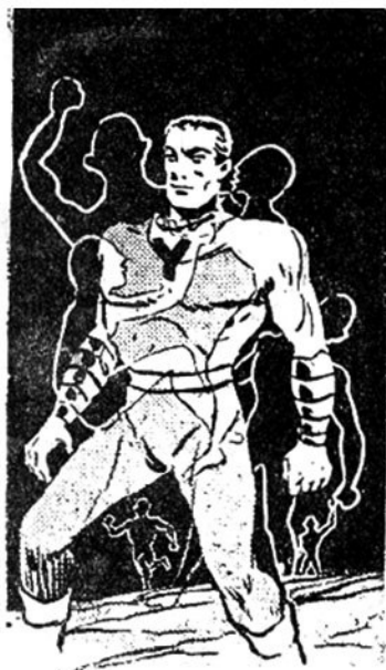
Τὰ χτυπήματα τῶν Κούι - Κρούξ ἔχουν τρομερὴ δύναμη!

»Απεναντίας, όσοι τα αγγίζουν, αρχίζουν να βγάζουν από το κορμί τους μι... έντονη ανάταυξη και τα μέλη τους τρέμουν. Πέφτουν στο τέλος αναίσθητοι! Όταν συνέρχονται, δεν έχουν πάθει τίποτα. Είναι σώοι και γεροί όπως