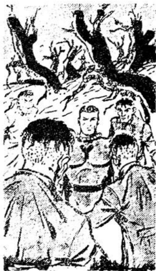
Τέσσερις πανομοιότυποι Άρστ τριγυρίζουν τον κατάπληκτο Ύπεράνθρωπο!

Καθώς το άεροσκάφος βγαίνει από την άτμόσφαιρα τής Γής και ταξιδεύει με ταχύτητα φωτός ανάμεσα στα διά-