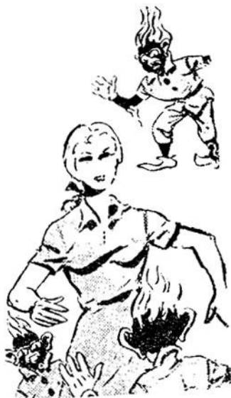
Δαίμονες τοῦ Πυρὸς ἔχουν ζώσει ἀπὸ παντοῦ τὴν Ἑλσα!

— Ἐγὼ δὲ θὰ βουτήξω!, δηλώνει ὁ Κεντοστούπης. Τὸ νερὸ εἶναι... κρύο! Δὲ θά... μπρρρ!