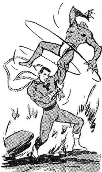
Ὁ Ὑπεράνθρωπος στριφογυρίζει τὸν Κοκκινάνθρωπο καὶ τὸν χτυπάει χάμω.

Μιὰ γυάλινη μπαλλίτσα σκάζει κοντά του κι' ἕνα ἄσπρο καὶ θολὸ ἀέριο τὸν τυλίγει. Μιὰ ἀβάσταχτη κάψα τὸν βασανίζει γιὰ μιὰ στιγμή, σὰν νὰ τὸν ἔριξαν μέσα