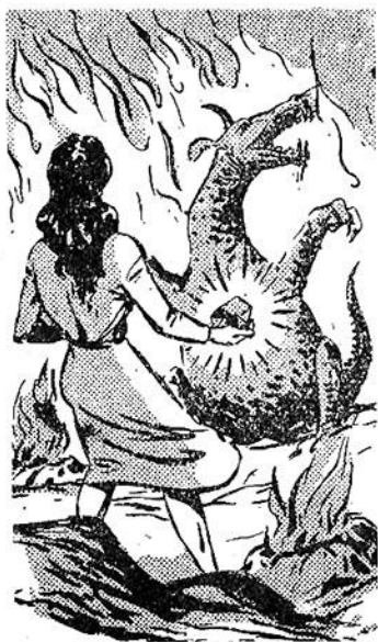
Μιὰ μυστηριώδης δύναμι ὀγαίνει ἀπὸ τὸ πετράδι και χτυπάει τὸ τέρας...

‘Η καφτερῆ του ἀνάσα ὀγαίνει με ὀρμη ἀπὸ τὰ ρουθούνια του και χτυπάει τὸν