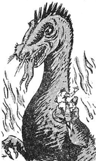
Το πελώριο θηρίο άρπάζει δύο από τους ύπκούς της βασίλισσας Έλένης!

Κάνει όμως το σφάλμα να επιτεθή αυτή τή φορά πολύ χαμηλά, σημαδεύοντας τήν κοιλιά του αντίπαλου της.