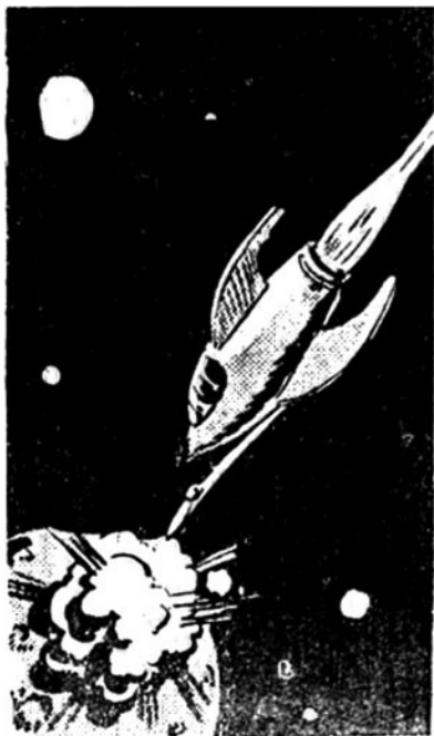
Μιά τρομακτική έκρηξι έγινε πάνω στον πλανήτη των Λευκών Οντων!...

— Νοιώθω μέσα μου μια έλαφρή, αλλά παράξενη και επίμονη εξέντλησι, Έλληνα! Πολύ φοβάμαι ότι δε θα διατηρηθώ για πολύν καιρό επάνω μου ή επίδρασι της λάμψεως! Ο οργανισμός μου, όπως και ο Οργανισμός των συντρόφων μου, είναι φτιαγμένος για το Κακό! Ίσως, λοιπόν, ή επίδρασι του Καλού δεν μπορεί να διατηρηθώ