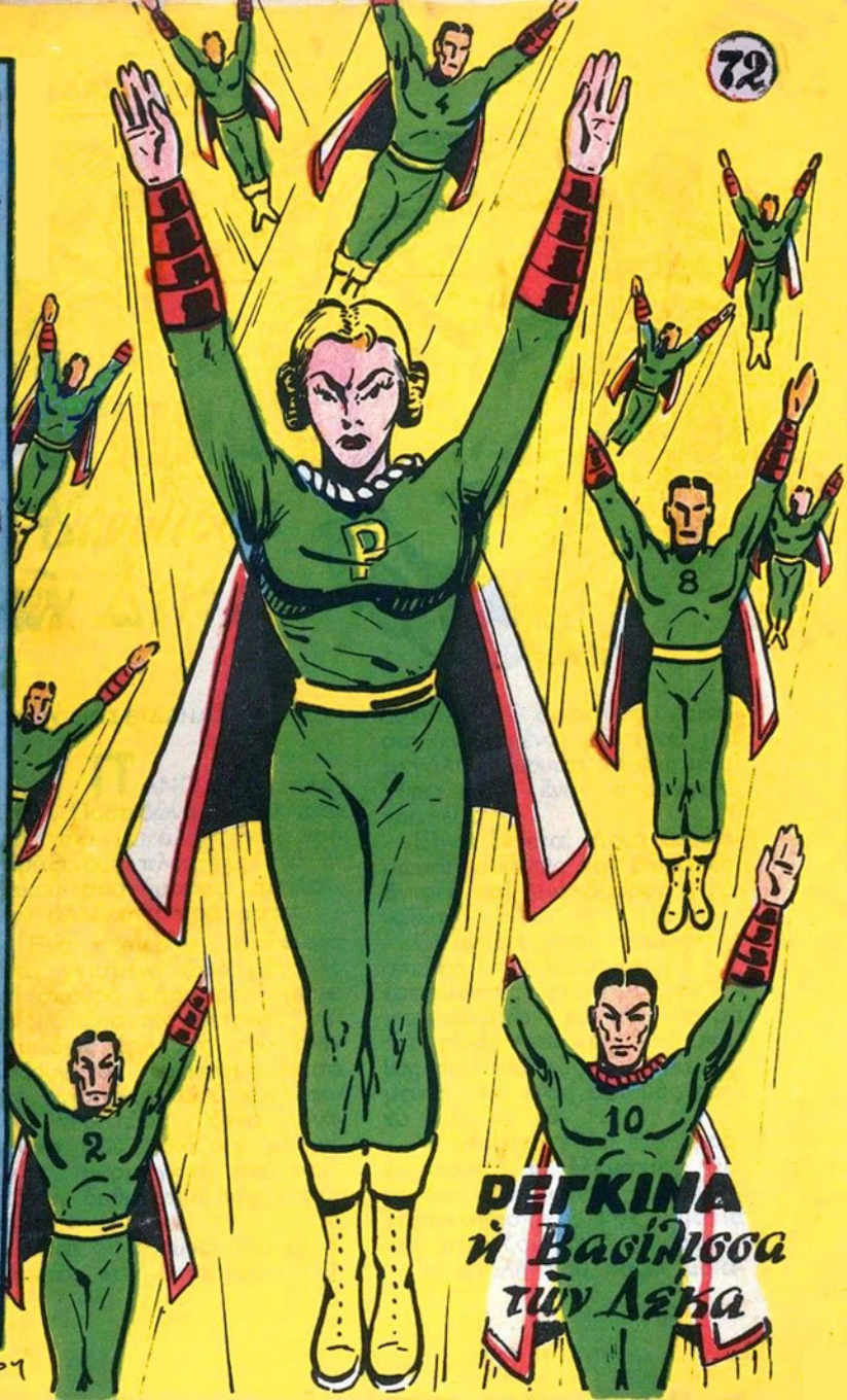
ΠΕΓΚΙΝΑ η Βασίλισσα των Δεκά