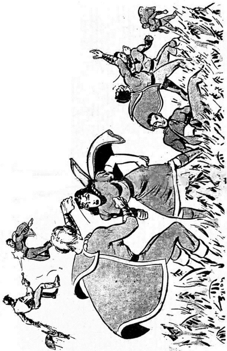
Μιά τρομακτική μέχη διεξάγεται ανάμεσα στους 'Υπερανθρώπους' και στους Δίκα 'Υπερανθρώπους' του Κακού της Ρεγκίνας!