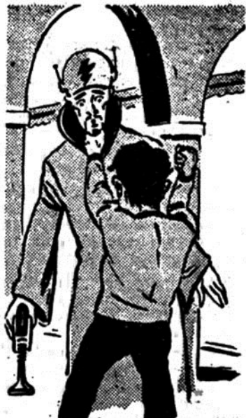
Ο νάνος αρπάζει τον Γκουαχέρα ξαφνικά από τό... γένη!

— Ναι!, απαντάει ο Γκουαχέρα. Με τις τέλειες έπιστη-