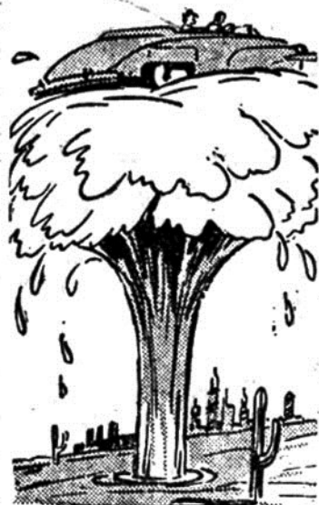
Το αυτοκίνητο, σπρωγμένο άπό τό τεράστιο συντριβάνι, ανεβαί- νει ψηλά!

— Θα πάρετε την άπάντη- ση στον Άλλο Κόσμο, όπου θα σας στείλουμε άμέσως!, άπαντάει ό ίδιος άνθρωπος. Τολμήσατε νά παραβιάσετε την ιερότητα τής Μαρμάρικης Πολιτείας και νά πατήσετε τό