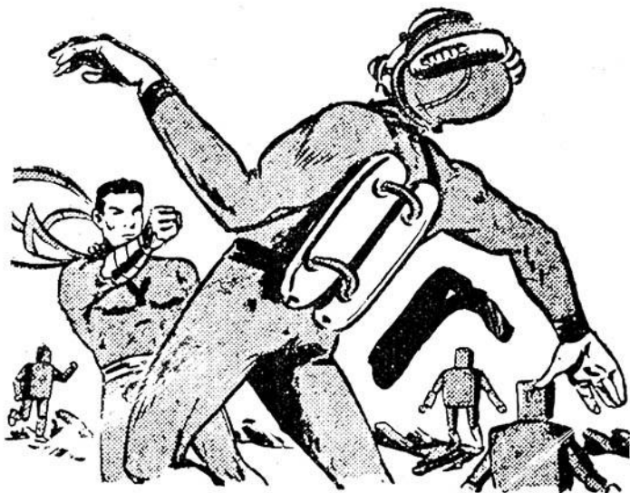
Οι γροθιές του 'Υπερανθρώπου κάνουν θαύματα!

Λιονους ρινόκερους και ίπποπόταμους, λιοντάρια και τίγρεις και ελέφαντες και από μικρόσωμου ανθρώπους — ρομπότ, που επιτίθενται όλα μαζί έναντίον των 'Υπερανθρώπων!