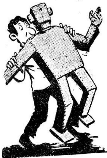
Καὶ ὁ νάνος... δαγκώνει τὸ ρομπότ!

Α Σ ΓΥΡΙΣΟΥΜΕ γὰρ λίγο πίσω, στὸν κῆπο τοῦ σπιτιοῦ τῶν Ὑπεράνθρωπων, ὅπου οἱ Χουάνα, πρὶν ἀπογειωθῶν, ἐξοφάνισαν μὲ τὰ τομερὰ πτεράλια τοὺς τὸν Κοντοστούπη.