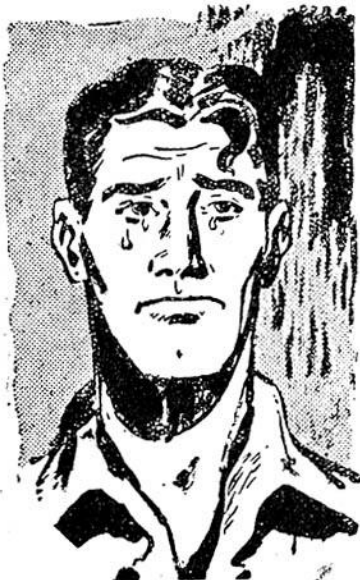
Δάκρυα κυλούν από τὰ μάτια το Έλ Γκρέκο...

Οί άλλοι Υπεράνθρωποι είναι καθισμένοι στη βεράντα,