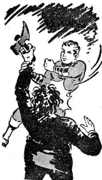
Ο Ύπερέλληνας έπεμβαίνει κεραυνοβόλα...

Ο Θεός του Πολέμου νοιώθει ένα διαπεραστικό πόνο στο κεφάλι και τα γόνατά του λυγίζουν! Θέλει να όρμησει έναντιον του Τζέκυλ, αλλά δεν μπορεί! Ο διαπεραστικός πόνος δεν τον άφήνει και