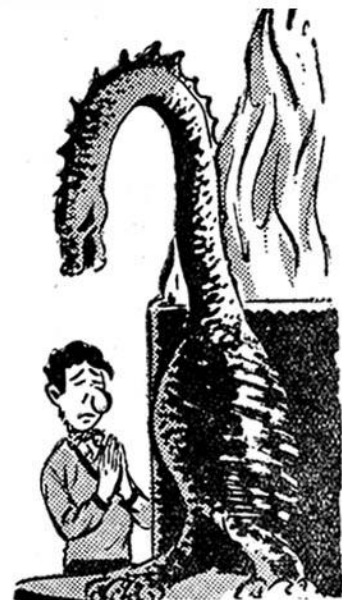
Ὁ ναὸς μурμουρίζει προσευχές...

κυλ καὶ ὁ Κτηνάνθρωπος χά- νει τὶς αἰσθήσεις του!