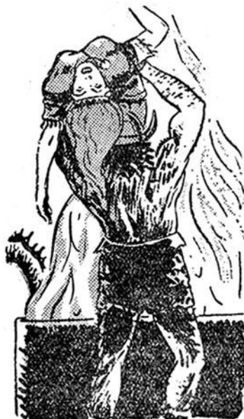
— Θά πεθάνης, Νυόκα!, γρυλλίζει ο Τρόμος.

Αφρίζοντας από λύσσα, ο έχθρος του Κόσμου συνεχίζει την περιπλάνησή του από άστρο σε άστρο ζητώντας βοήθεια, που δεν του δίνει κανείς. Σ' ένα μόνο πλανήτη βρήκε φιλοξεनिया.