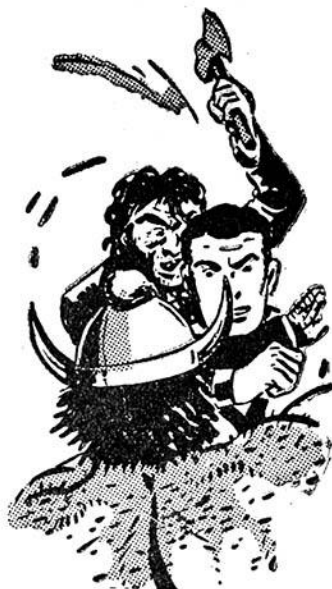
Ὁ Ὑπεράνθρωπος βρίσκεται σὲ δύσκολη θέση!

Ὅταν ἀνοίγει πάλι τὰ μάτια του, νοιώθει μιὰ ἀπέραντη ἀδυναμία στὸ κορμί! Δὲν μπορεῖ νὰ σαλέψη τὰ μέλη