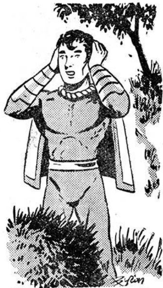
Κάθε ἦχος, κάθε θόρυβος ἔχει χαθῆ!

«Μιλῶ στους Ὑπεράνθρώπους, τους έχθρους μου! Είμαι ὁ Τζέκυλ, ὁ Αὐτοκράτωρ τοῦ Κόσμου! Αὐτὸ πού συνέβη πρὶν ἀπὸ λίγο ἦταν ἓνα μικρὸ δείγμα τῶν καταπληκτικῶν νέων ἐφευρέσεων, πού ἔχω στὰ χέρια μου! Μὲ τὰ νέα ὄπλα πού διαθέτω τώρα μπορῶ νὰ κάνω ἀπίστευτα πράγματα καὶ νὰ προκαλέσω ἀφάνταστες καταστροφές! Φαντάζομαι τὴν ἔκπλη-