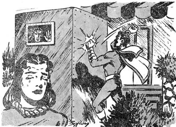
Τὰ μάτια τῆς Ἀστραπῆς δακρῦζουν...

— Θεέ μου!, μουρμουρίζει ἡ κόρη τοῦ Ὑπερανθρώπου. Ποτέ ἄλλοτε στὴ ζωὴ μου δὲν ἔχω δεχτὴ τόσο δυνατὰ χτυπήματα!