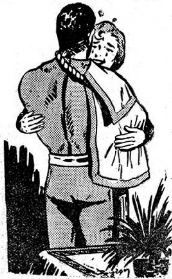
— Άντρούλη μου! Άγαπημένε μου!

— Μάζεψε τα λόγια σου. Ύπεράνθρωπε!, άκούγεται ή φωνή του νάνου. Λιποθυμάει ποτέ ο Κοντοστούπης; "Έχε