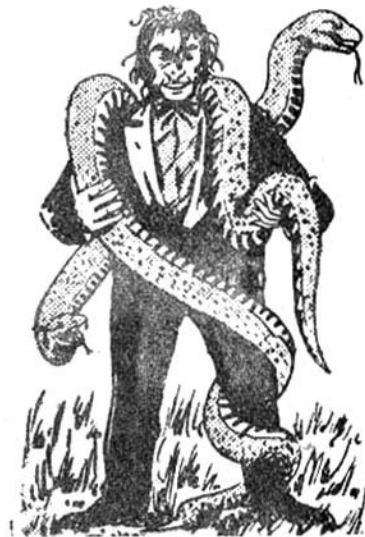
Τὸ γέλιο τοῦ Τζέκυλ ἀντήχησε ἀνατριχιαστικά...

Ἡ σαύρα κυττάζει παράξενα τὸν Κοντοστούπη μὲ τὰ μικρά γυαλιστερά μάτια της ἐνώ ἀπὸ τὸ μισάνοιχτο στόμα της βγαίνει ἔξω μιὰ μακροῦλη γλώσσα και σαλεύει κοροϊδευτικά! Στὸ μουσοῦδι της διαγράφεται ἕνα κωμικὸ χαμόγελο! Ἀπὸ τὸ λαρύγγι της βγαίνουν κάτι περίεργοι ἤχοι, σὰν χαχανητά!