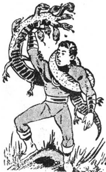
Ἡ Λερναία Ὕδρα τύλιξε τὸν Ὑπερέλληνα!

Μ' ἓνα πήδημα, ἡ Ἀστραπὴ ἀπομακρύνεται κρατώντας τὴ συσκευή τοῦ ἀόρατου θόλου στὴν ἀγκαλιά της. Μὲ