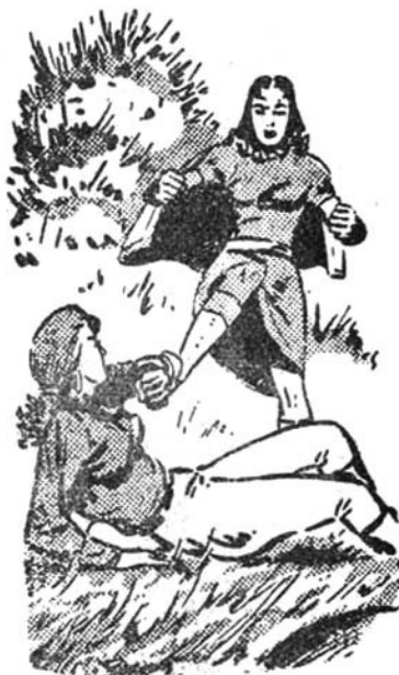
Μὲ μανία ἡ Ἄστραπὴ γρονθοκοπáει καὶ ποδοπατάει τὴ Φάουστα

Ἄμέσως, οἱ δυὸ ἥρωες φανερώνονται στὴν ὄθνη. Πε-