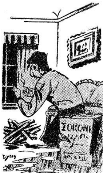
“Ο Κοντοστούπης βάζει φωτιά στο σαλόνι!”

στε! Χαθήκαμε! Θα γίνουμε...ψητοί! Βοήθεια! “Ωχ η καρδούλα μου!