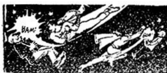
‘Ο Κοντοστούπης ...έγκεφαλος!

Γ ΥΡΙΖΟΥΝ γοργά στο σπίτι των ‘Υπερανθρώπων. ‘Η ‘Αστραπή σταματάει τη μηχανή του άοράτου θόλου τους αφήνει να προσγειωθούν στη βεράντα και την ξαναβάζει σε λειτουργία.