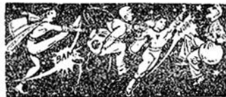
Ἡ Ἐκδίκησις τῆς Φάουστας

—Βγῆτε όλοι ἔξω! Ἡ ἐκκλησία θὰ τιναχθῆ στὸν ἀέρα!