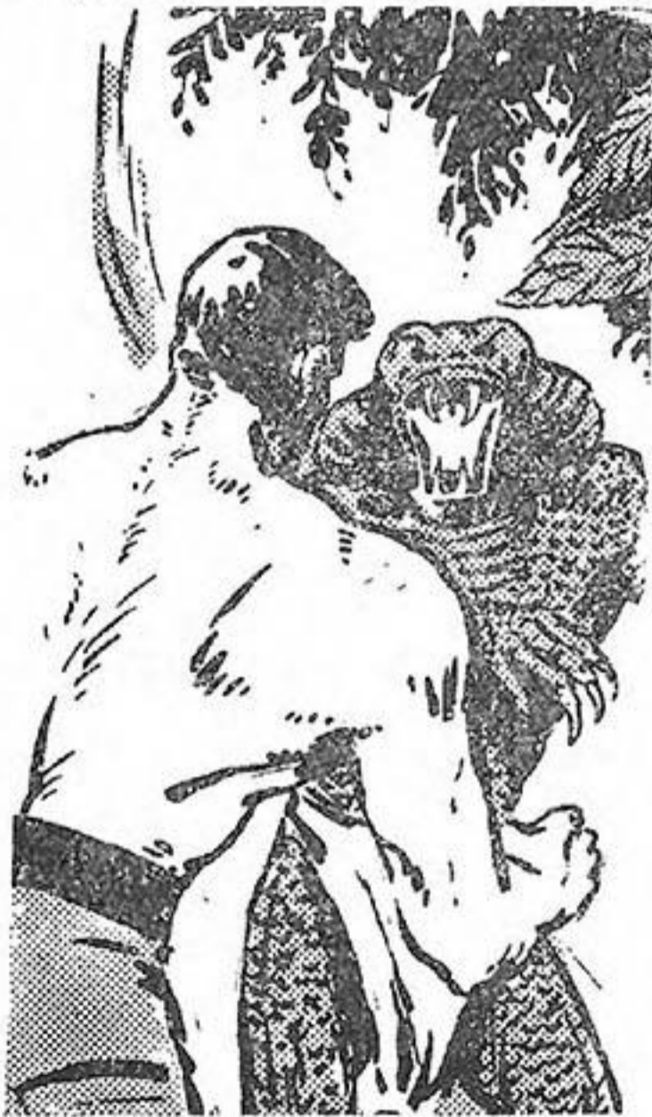
Ὁ Τάργκα κι' ὁ Καλούγκα, ὁ Κύριος τῶν Ἀετῶν, συγκρούονται!

Καταλαβαίνει ὅτι εἶναι ἡ πολεμικὴ κραυγὴ τῶν Κίντου. Φαίνεται πὼς κάπου ἐδῶ γύρω γυρίζουν δυὸ - τρεῖς ἀπ' αὐτούς. Ποῦ ὅμως εἶναι; Ἀποφασίζει ν' ἀνέβῃ σ' ἕνα ψη