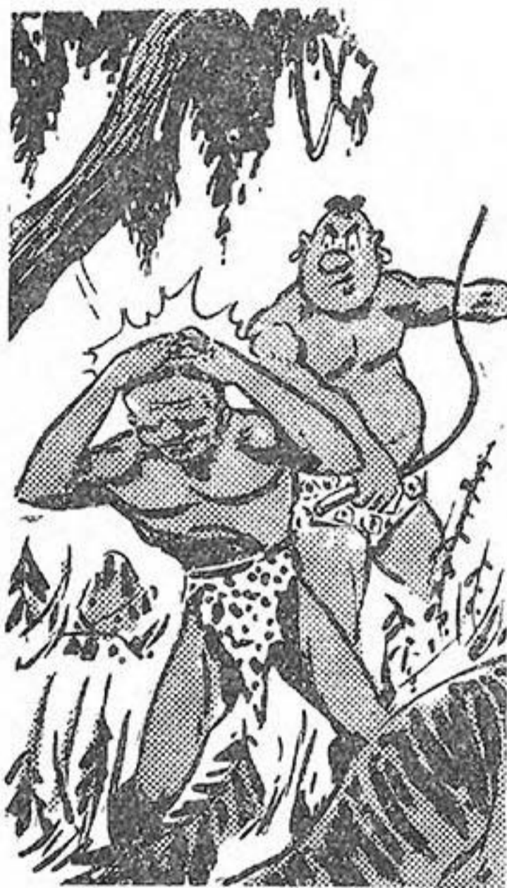
Τὸ χέρι τοῦ Ἀτσίδα κατεβαίνει μὲ δύναμι!

Μόλις βλέπουν τοὺς δυὸ δι- κούς τους ν' ἀρχωνται, πετά- γονται ὄρθιοι καὶ βγάζουν ἀ-