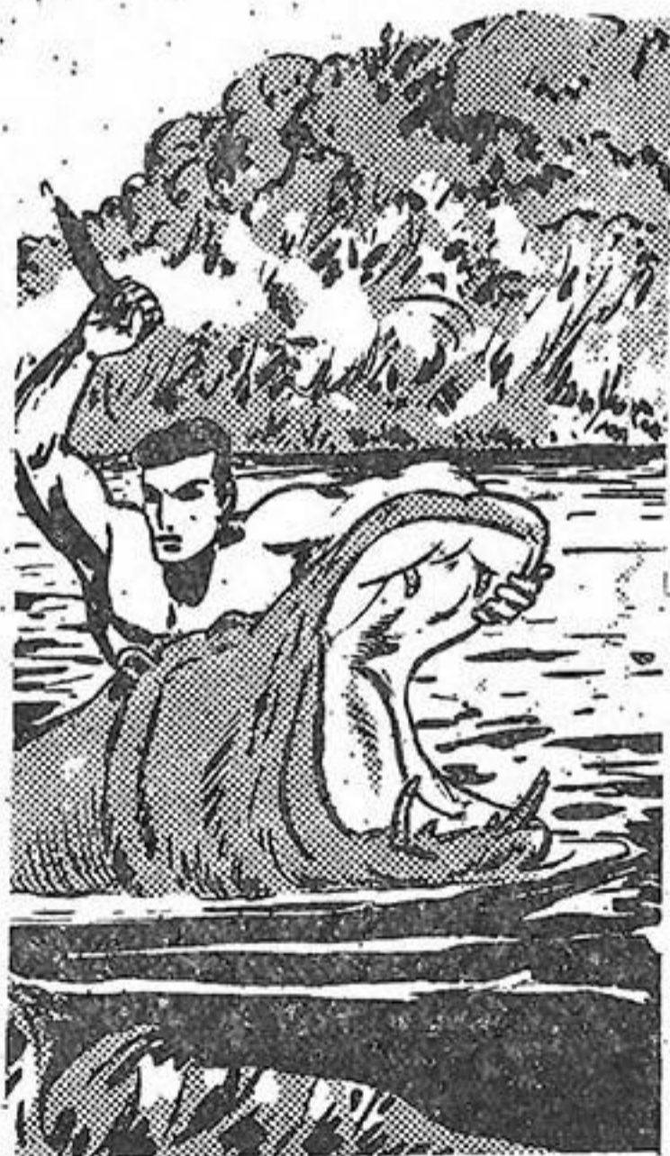
Το μαχαίρι του Τάργκα χτυπάει άλύπητα το άηδές παχύδερμο!

Τα κοντάρια τους είναι ύψωμένα. Ούρλιάζουν όλοι σαν δαίμονες.