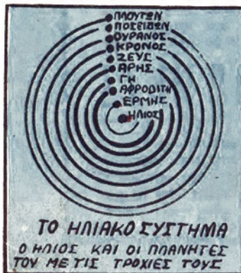
ΤΟ ΗΛΙΑΚΟ ΣΥΣΤΗΜΑ Ο ΗΛΙΟΣ ΚΑΙ ΟΙ ΠΛΑΝΗΤΕΣ ΤΟΥ ΜΕΤΙΣ ΤΡΑΧΙΕΣ ΤΟΥΣ

ΑΠΟ ΤΑ ΠΑΛΙΑ ΧΡΟΝΙΑ Ο ΑΡΗΣ Ε- ΚΑΝΕ ΕΝΤΥΠΩΣΗ ΣΤΟΥΣ ΑΝΘΡΩΠΟΥΣ. ΑΡΗΣ ΤΟΝ ΕΠΑΤΡΕΥΑΝ ΩΣ ΘΕΟ ΤΟΥ ΠΟΛΕΜΟΥ