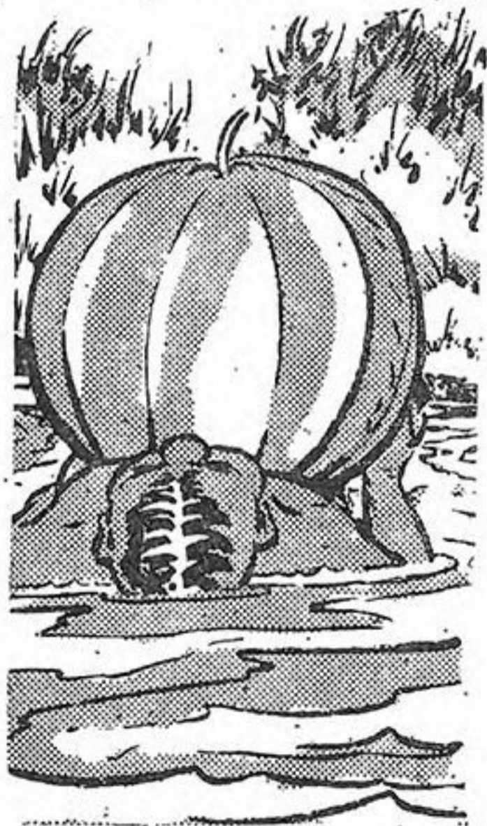
Ο 'Ατσίδας ἐπιπλέει μὲ τὸ πεῶριο κασπούζι πάνω στὴν κοιλιὰ του.

νός πάντα σὲ δέντρο, ἔχει φτάσει πολὺ κοντὰ στὸν ἰθαγενῆ. Βλέπει τὴ φοβερὴ ἐπίθεσι τοῦ θηρίου καὶ κοντοστέγεται.