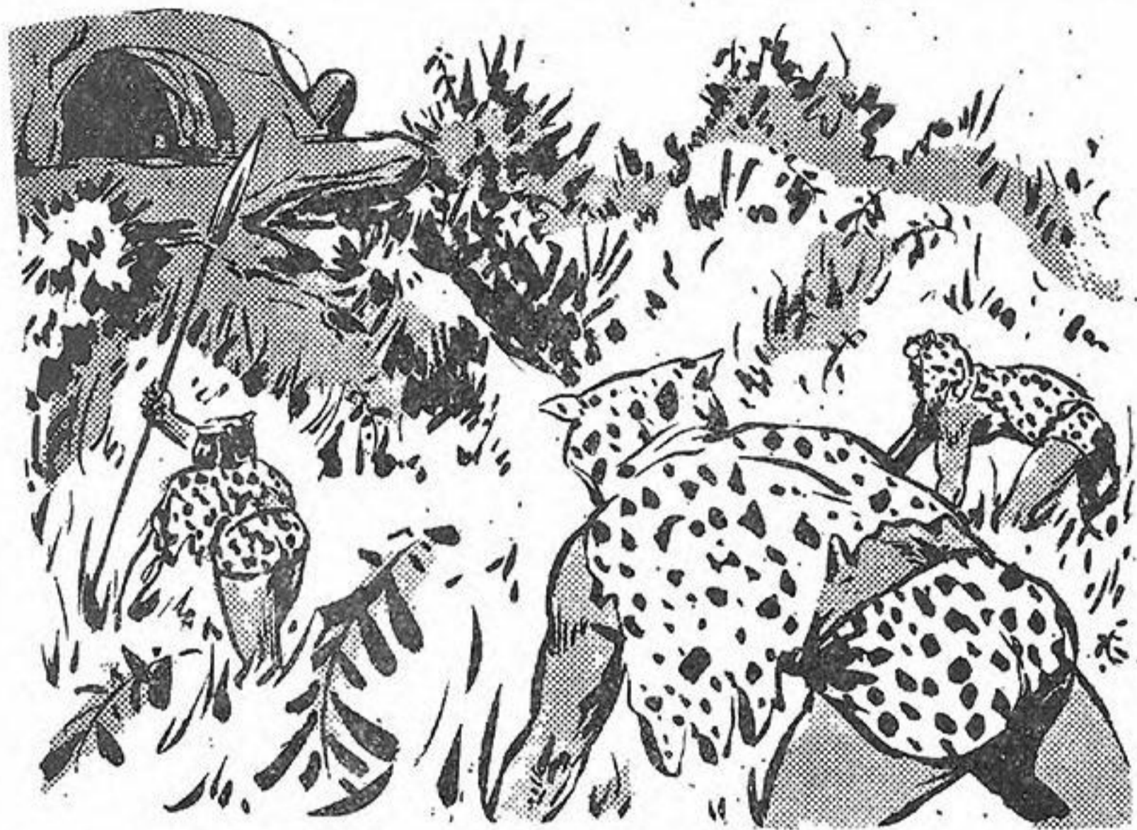
Οι Χάντα προχωρούν άκροβελιστά προς τή σπηλιά του Τάργκα.

νει μιὰ καὶ πέφτει στὸ νερό. Τὸ πλαδαρὸ σῶμα του βυθίζεται στὴν ἀρχὴ κι' ἔπειτα ξαναβγαίνει στὴν ἐπιφάνεια σιγά-σιγά, σὰν μαῦρο μπαλόνι. Ἐκεῖ ἐπιπλέουν ἄγρια ὑδροχαρὴ φυτὰ, πελώριες νεροκολοκύθες, χοντρά καρπούζια καὶ ἄγρια πεπόνια.