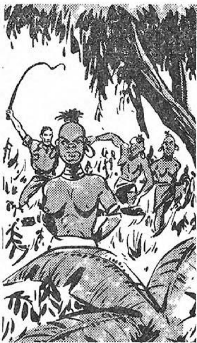
Λευκοὶ ἄνθρωποι μαστιγώνουν ἀλύπητα τοὺς ἰθαγενεῖς

κλάδους τῶν ἀναρριχητικῶν ποὺ χρόνια τώρα πλέκονται ἤσυχά ἀνάμεσα στοὺς κορμούς τῶν αἰωνόβιων δέντρων καὶ φράζουν τὸν δρόμο, σχηματίζοντας ἓνα καταπράσινο τεῖχος. Τὰ τάμ-τάμ ἀκούγονται ὀλοένα καὶ πιὸ καθαρά. Καί, ξαφνικά ὁ Τάργκα στέκεται. Σ' ἓνα μικρὸ ξέφωτο, ποὺ σχηματίζεται λίγο παρακάτω, μιὰ πένθιμη συνοδεία περνάει. Εἶναι μιὰ ὀλόκληρη στρατιὰ ἀπὸ ἰθαγενεῖς, γυναῖκες κι' ἄντρες, ποὺ προχωροῦν δυό-δυό, μὲ τὰ κεφάλια σκυφτὰ καὶ μὲ τὰ χέρια δεμένα πισθάγκωνα, ἀπάνω σὲ