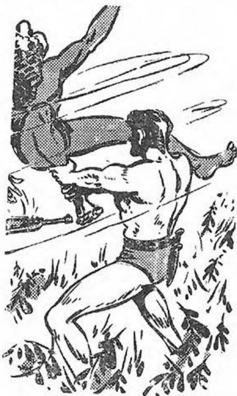
‘Ο Τάργκα τòn άρπαξε άπ’ τò πόδι και τòn στριφογύρισε στòn άέρα...

Τὰ κόκκαλα τού γιγάντιου κορμιού του τρίζουν κιόλας, κάτω άπ’ τή συντριπτική σύσφιξι τού μυώδους σώματος τής άνακόντα. ‘Ο θώρακάς του, συμπιεγμένος άβάσταχτα, δέν μπορεί ν’ άκολουθή-