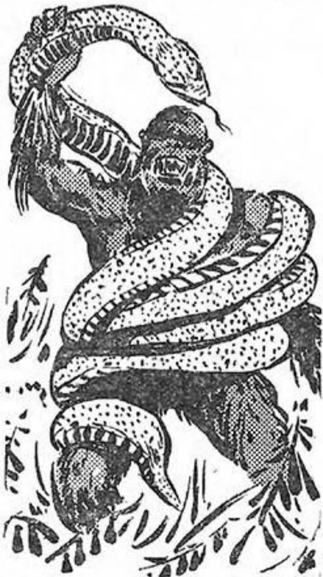
Τὸ πανίσχυρο χέρι τοῦ Χόου— Χὸ ἄρπαξε τὴν ἀνακόντα...

Γύρω τους δὲν φαίνεται κανεὶς ἐχθρὸς καὶ ἡ πρώτη