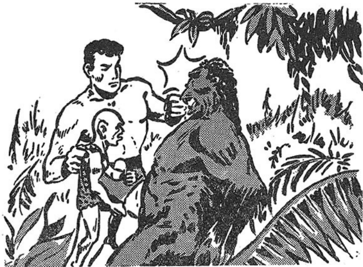
‘Ο Τάργκκα, κρατώντας τὸν Χαμόρ μὲ τὸ ἓνα χέρι τσακίζει τοὺς γοριλλες μὲ τ’ ἄλλο!

άρχων τῆς ζούγκλας δουλεύει μὲ ψυχραιμία καὶ ἀφάνταστη γρηγοράδα. Τὸ ἀκόντιο τῆς Μαλόα, τὸ μαχαίρι τῆς καὶ τὸ μαχαίρι τοῦ Τάργκκα, οἱ γροθιές τους καὶ τὰ γόνατά τους, χτυποῦν πρὸς κάθε κατεύθυνσι, σκορπίζοντας τὸν πανικό καὶ τὸ θάνατο!