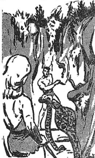
Βρέθηκαν μέσα σ' ένα λάκκο με κόμπρες!

— Είσαι αιχμάλωτός μου, Τάργκα, έσύ κι' οι σύντροφοί σου! Δέν είσαι πιά ο Κυρίαρχος της Ζούγκλας! Κυρίαρχος της Ζούγκλας είμαι τώρα εγώ, ο Χαμόρ, ο μεγάλος μάγος με τις άπεραντες δυνάμεις! 'Ο λαός των γοριλλών είναι δικός μου! Και θά γίνουν δικοί μου όλοι οι λαοί της ζούγκλας, γιατί έχω στήν κατοχή μου το περίφημο μαγικό πετράδι «Κουέρα», που δίνει δύναμη και δόξα και έξουσία! Χρόνια τώρα έψαχνα να το βρω μέσα σε μιá