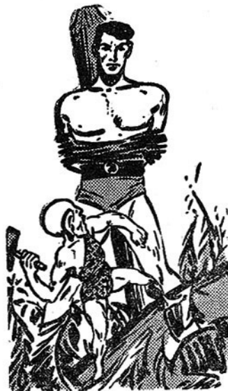
Και ο Χαμόρ σηκώνει τὸ τρομερό τσεκούρι του!

η ζούγκλα γύρω από τους ήρωές μας έχει μείνει έρημη και σιωπηλή. Ο μόνος ήχος που ακούγεται είναι τὰ ποδοβολητά και οι κραυγές τῶν γοριλλῶν, που ὄλο και ξεμακραίνουν.