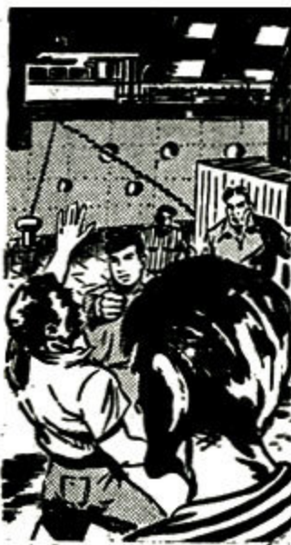
Το δωδεκάχρονο παιδί τσάκιζε τους ναυτες στο ξύλο!

— Κύριος Τάργκα!, λέει ανάμεσα στους λυγμούς του.