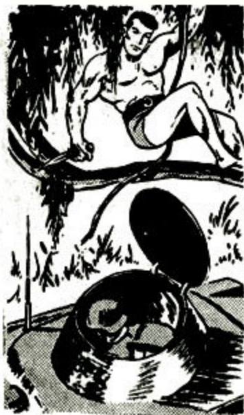
Ὁ Τάργκα πέφτει ὀλίσσια μέσα στο τάνκ!

Πραγματικά, ὁ Τάργκα θγάζει τοὺς νεκροὺς γερμα-