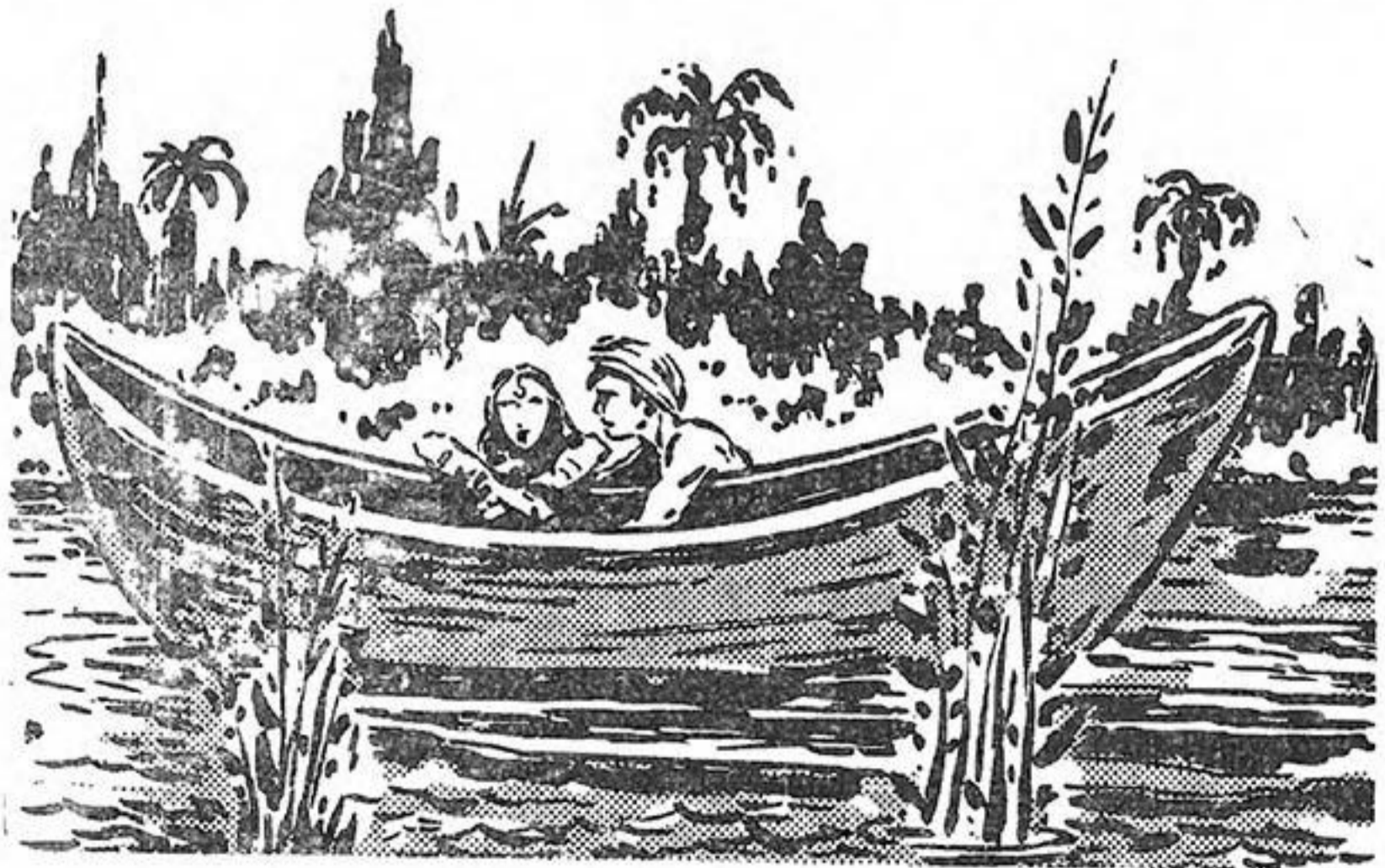
Τὰ δυὸ παιδιά βλέπουν νά ζωντ ανεύουν οί έλπίδες τῆς σωτηρίας καθὸς πιάνονται άπό τὴ βάρκα.