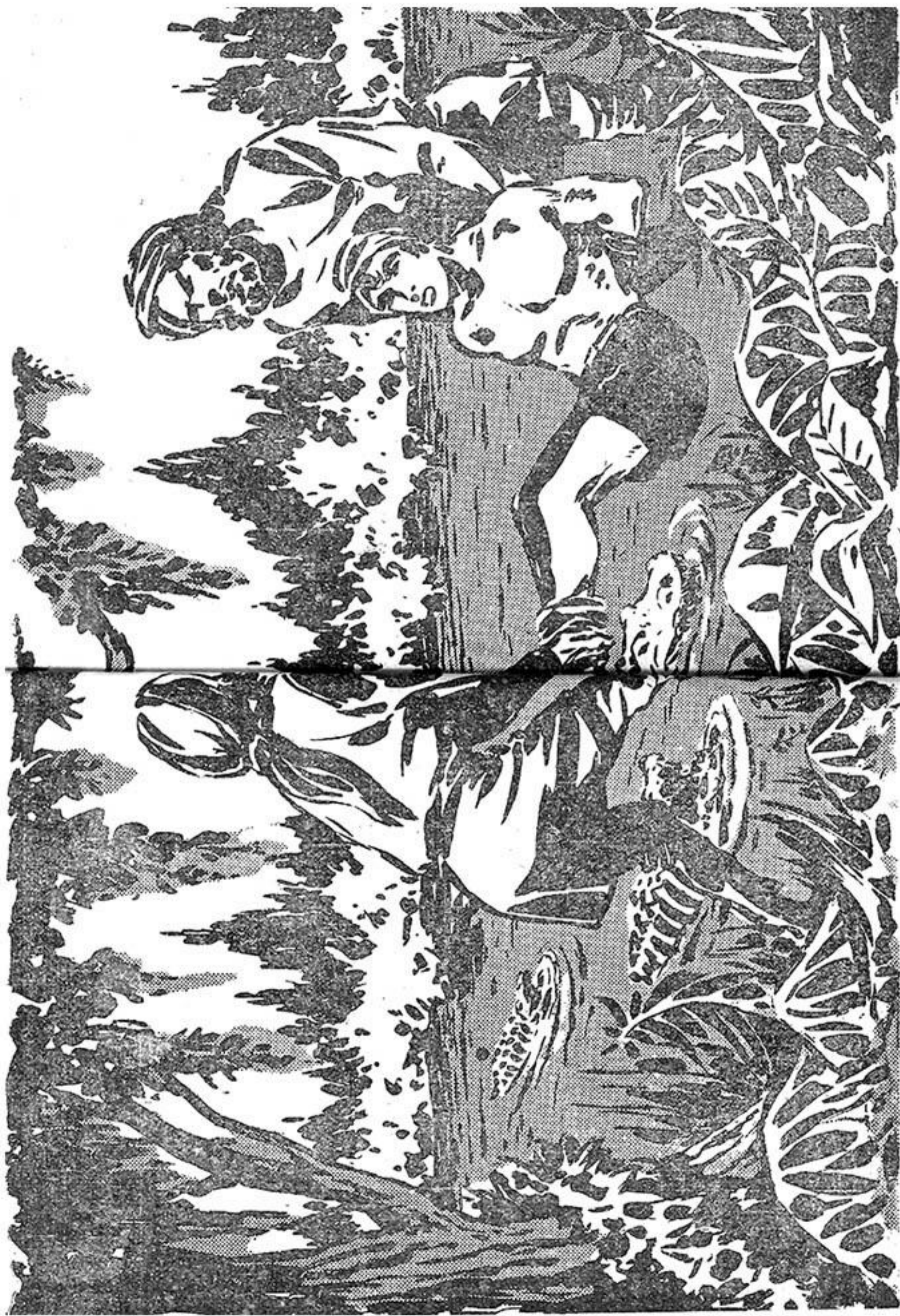
Τὸ ἥρωϊκὸ Ἑλληνόπουλο βλέπει μὲν ὅτι πλησιάζει τὸ τέλος τοῦ.