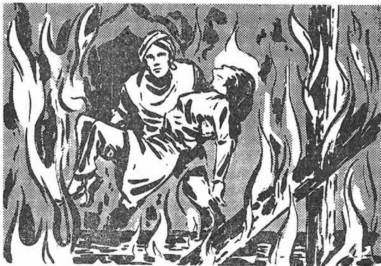
Ο Μαλαμπάρ γλυτώνει από τον θάνατο την Ζανγκάρ και θγαίνει μαζί της από τις φλόγες.

Και την ίδια στιγμή σαλπάρει σα σαίτα στη ράχη ενός άλλου αλόγου χωρίς καβαλλάρη, που περνάει τρομαγμένο δίπλα τους. "Ετσι, όπλος καθώς είναι, καβάλλα στ' αλόγο, ρίχνεται μέσα στη μάχη που έχει φουντώσει. Οί Ινδοί πυροβολούν στο ψαχνό. Μά και οί Άγγλοι στρατιώτες δεν άστειεύονται. Ο άέρας έχει γεμίσει από βροντές και μυρουδιά καμμένου μπαρουτιού.