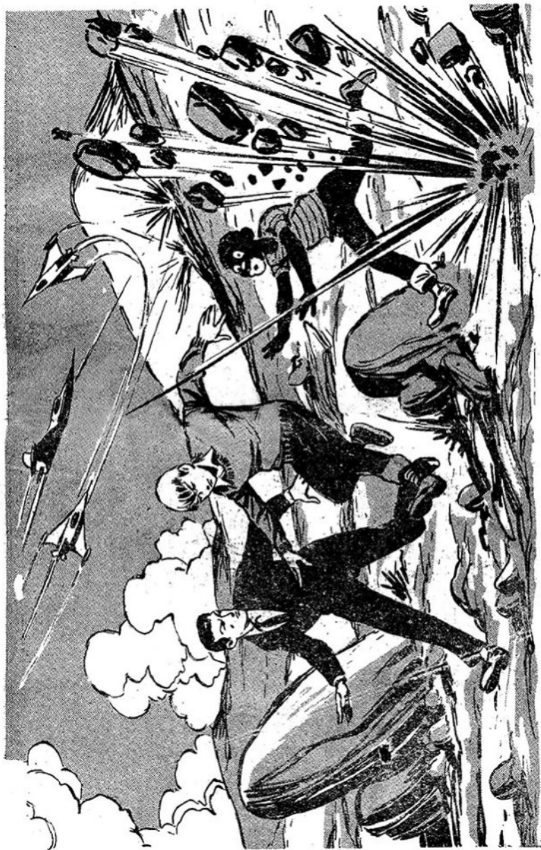
Ήταν ο τελευταίος δάμος που έσκασε πλάι τους. Πίσα σ'ε βουνό, τ'ε άφριαθούμενα του. Άμερικανικού σ'ιρατού περι- ποιάνταν ένας τους άξιζε τους προδότες.