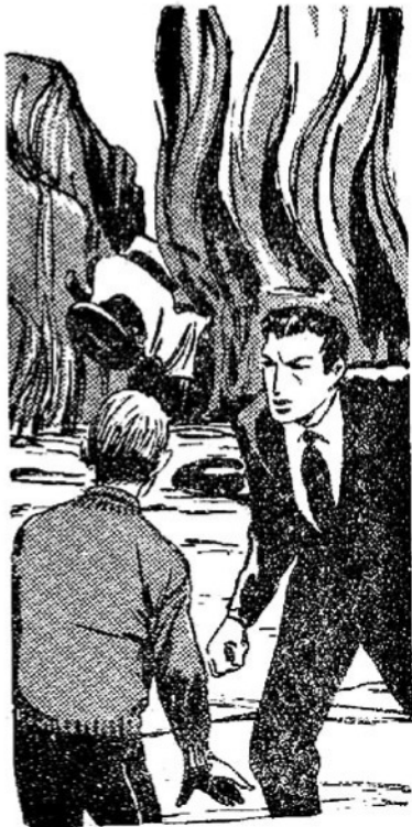
—Νά πας εκεί μαζί με τόν Τζέπου!

'Ο Τζέε Μόρτιν όπως ήταν στο πίσω μέρος δέν μπόρασε νά πατήσει τό φρένο. Τό άμάξι έπεσε με όλη του τή φόρα πάνω στα βράχια. Τό χτύπημα ήταν τραμερό. Σάν λαβωμένος γίγαντας τό αυτοκίνητο σηκώθηκε όλόρθο στις πι-