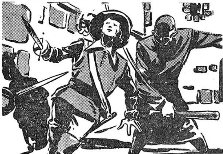
Και τότε ξαφνικά τὸ ἥρωικό παιδί δέχεται ἕνα δυνατό χτύπημα στο πίσω μέρος τοῦ κρανίου.

σεις στὸν Τριμπουσὸν γιὰ νὰ πεισθῶν πιὸ θετικά γιὰ τὰ ὄσα τοὺς λέει, ἀλλὰ δὲν προφταίνουν γιατί ἀπὸ μακριὰ ἀκούγεται τὸ ἀργὸ περπάτημα ἑνὸς ἀλόγου.