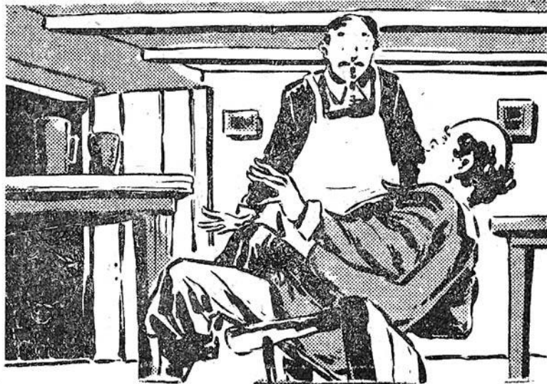
— Παναγίτσα μου! ξεφωνίζει ὁ Τριμπουσόν. Μιά τίγρις!...