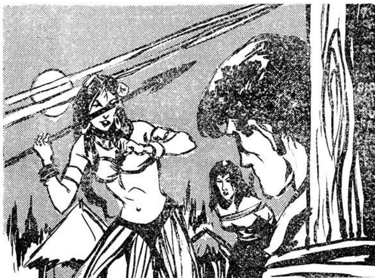
Ἡ Καλόα σηκώνει ἄγρια τὸ ἀκάντιο!