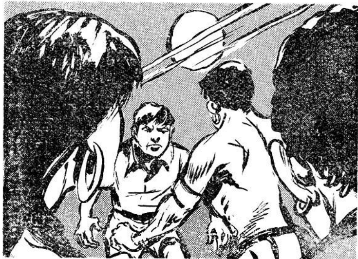
Τὸ παιδάκι καὶ ὁ γίγας ἀντιμετωπίζονται.

Στὸ μεταξύ μᾶσα στὴν καλύβα τῆς Καλόρα ὁ Γιώργος ἐξηγεῖ τι πρέπει νὰ γίνῃ: