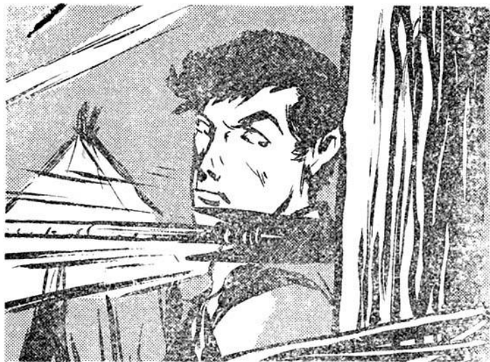
Τὸ ἀκόντιο καρφώνεται δίπλα στὸ κεφάλι του!

— Ἐντάξει Παιδί - Φάντασμα, ἀπαντᾷ ὁ ἀρχιστράτηγος. Θὰ τὰ ἔχης ὅλα αὐτὰ σὲ δύο ὧρες, ἂν ἐσύ καὶ οἱ φίλοι σου μπορεῖτε νὰ ξεκινήσετε τόσο σύντομα. Θὰ χρειαστῆ ὁμως νὰ κάνετε ἓνα ἢ δύο σταθμούς. Οἱ τρίτοι καταρράκτες τοῦ Νείλου ἀπέχουν ἀπὸ τὸ Κάιρο περισσότερο ἀπὸ χίλια χιλιόμετρα καὶ ἡ βενζίνη δὲ θὰ σᾶς φτάση. Θὰ σᾶς πῶ σὲ ποῖα σημεῖα τῆς Αἰγύπτου μπορεῖτε νὰ προσγειωθῆτε γιὰ νὰ ἀνεφοδιασθῆτε μὲ βενζίνη.