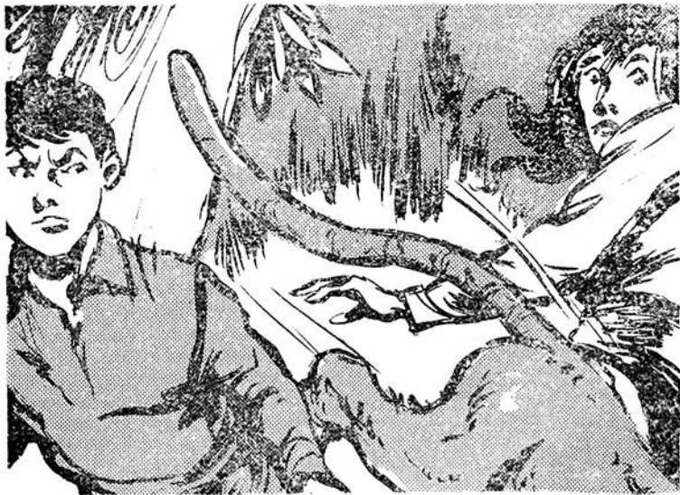
Ὁ ἀγριόγατος περνᾶ ἀνάμεσά τους!

— Μὰ δὲν καταλαβαίνω, κάνει ἡ Κατερίνα. Ἐσύ δὲ δέχεσαι νὰ ἀναλάβης ἀποστολὴ ἂν δὲν σοῦ ἐξηγήσουν μὲ κάθε λεπτομέρεια τὴν ἀκριβῶς συμβαίνει. Καὶ δὲν δέχεσαι νὰ κάνουμε κάτι ποὺ δὲν ἔχει ἐπίδραση στὴν τύχη τῆς πατρίδας μας. Πῶς τώρα δέχτηκες νὰ πάμε εἰς τὴν Αἴγυπτο χωρὶς νὰ σοῦ ἐξηγήσῃ ὁ ἀρχιστράτηγος