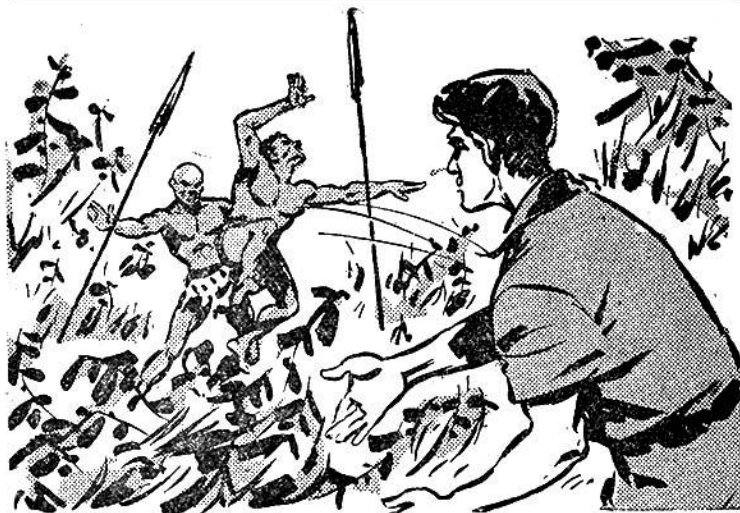
Ο Γιώργος τινάζει τον ξύλα Ιθαγενή πάνω στον έδαλο!

πτο και με τους φίλους του μπαίνει στην πόλι και προχωρεί προς την κεντρική πλατεία.