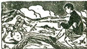
Ἡ ἀποκάλυψιν τῶν κατασκόπων