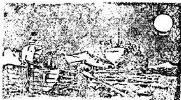
Ἀνάβασις στὸ βουνό

Ντάρ ἐς Σαλαάμ, ἐνῶ ὁ οὐρανόσ ἐχει ἀρχίσει νὰ γίνε-ται γκριζὸς πρὸς τὸ μέρος τῆς ἀνατολῆς. Τὰ τέσσερα τοιμῆρὰ παιδιὰ ξεκινοῦν γιὰ τὴν πιὸ ἐπικίνδυνη ἀποστολὴ τῆς ζωῆς τους.