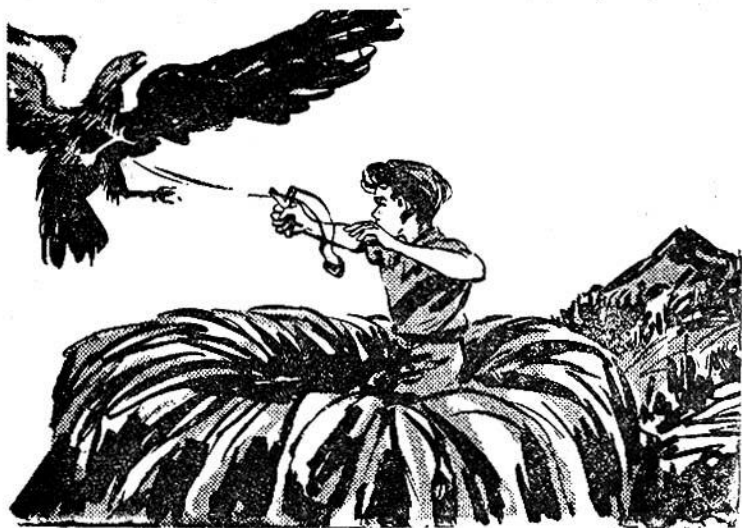
Ὁ Διαβολάκος στέλνει ἐναντίον τοῦ ὄρνειου μιά μολυβένια μπαλίτσα!

Δίνει λοιπὸν διαταγὴ στὸν πιλότο νὰ γυρίσῃ στὴν Αἴγυ-