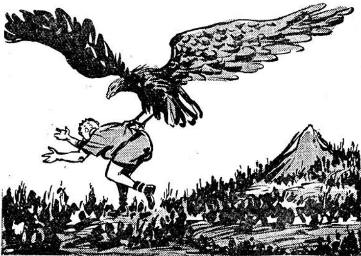
Ὁ ἀετός σηκώνει στὸν ἀέρα τὸ Σπίθα μετὰ τὰ νύχια του!

Και ξαφνικά, ὅταν πιά ὁ Σπίθας ἀρχίζει νὰ βογγᾷ