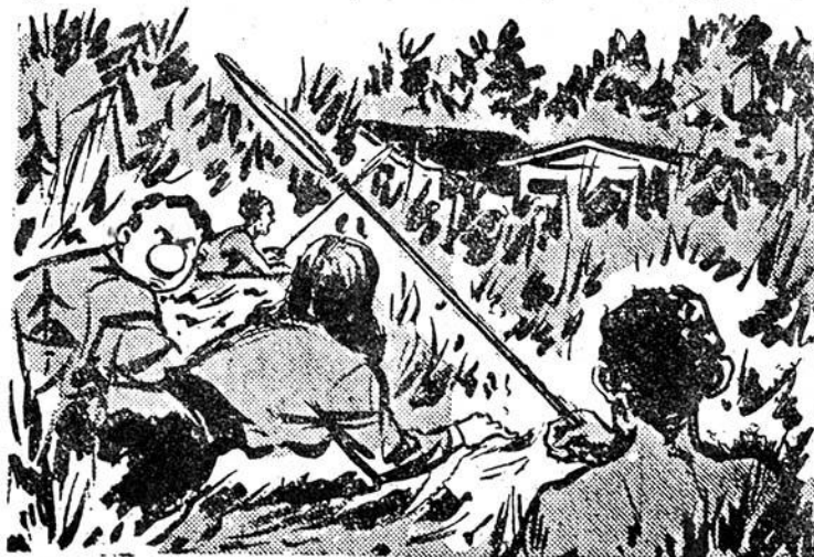
Σέρνονται άργά πρός τά γερμανικά κτίρια....

Σηκώνεται με τις δυνάμεις του άναναωμένες και κυττάζει τó ρολόι του. Πρέπει να πάη στο ραντεβού του με τó έλικόπτερο. Ύπολογίζει δ-