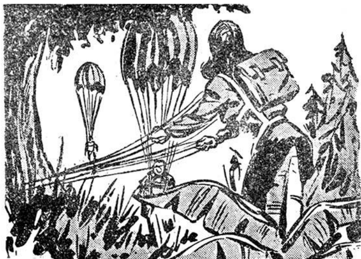
Πέφτουν από τὸ ἐλικόπτερο με ἀλεξίπτωτα,...