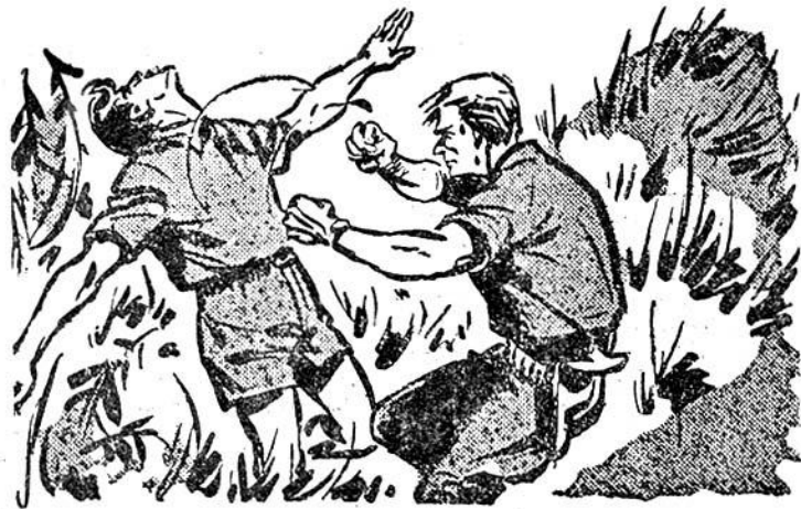
Μιά τρομακτική σύγκρουσις αρχίζει ανάμεσά τους!

— Τί λέει ο άνθρωπος αυτός; ρωτάει ο Γιώργος την