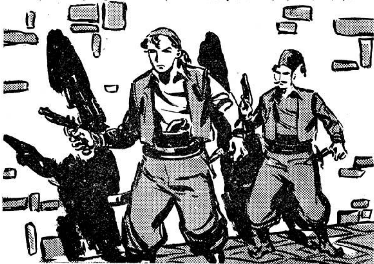
Τὰ δυὸ ἀδελφία μὲ τὰ πιστόλια στὸ χέρι γλιστροῦν στὸ σκοτάδι

— Τώρα μπορούμε νὰ φύγουμε!, λέει κι' ἕνα χαμόγελο βριάμβου σχεδιάζεται στὸ πρόσωτό του. Σὲ λίγο ὅλα τὰ σπίτια τοῦ Καθίκιοι θ' ἀρχίσουν νὰ χορεύουν καρσιλαμῆ κι' ἀπ' τὸ σεράϊ του ὁ σουλτάνος θὰ καμαρώνῃ τὴ φωτο-