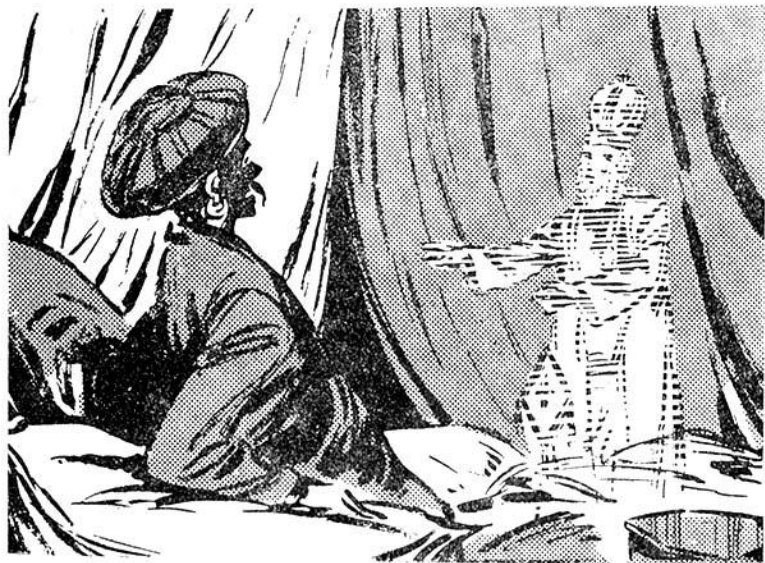
Τὸ φάντασμα τοῦ Πατριάρχου κινηγοῦσε τὸν αἰμοδόξο σουλτάνο Μαχμούτ μέσα στὸ σεραΐ.

"Ὁμως αὐτὴ ἡ χαρὰ κόβεται ἀπότομα, καθὼς φτάνουν ἔξω ἀπὸ τὸ πατριαρχεῖο. Ὁ τόπος ὅπου βρίσκεται κρεμασμένος ὁ πατριάρχης, εἶναι γεμάτος ἀπὸ καβαλλάρηδες καὶ στρατό. Ἀπὸ μακριὰ βλέπουν τὸ κορμὶ τοῦ Γρηγορίου