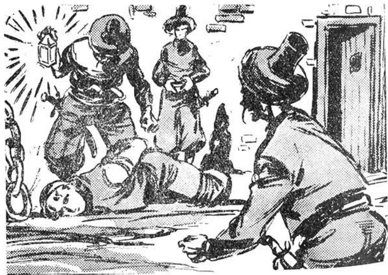
'Ο γενίτσαρος ρίχνει τὸ φῶς τοῦ λαδοφάναρου ἀπάνω στοῦ πρό- σωπο τοῦ 'Ελληνόπουλου ...

— Καί τὸ λὲς ἔτσι αὐτὸ καὶ γελάς, ώρὲ γκιαούρ; ἀγρι- εὖει πιὸ πολὺ ὁ γενίτσαρος.