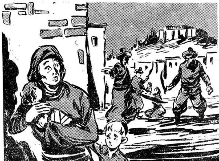
Τὸ παιδομάζωμα στὴν Ἀθήνα γινόταν κάθε τέσσερα χρόνια.

Μὰ ἐκεῖνοι: δὲν πίστευαν και κατέβηκαν στὸ ὑπόγειο. Ἄνα