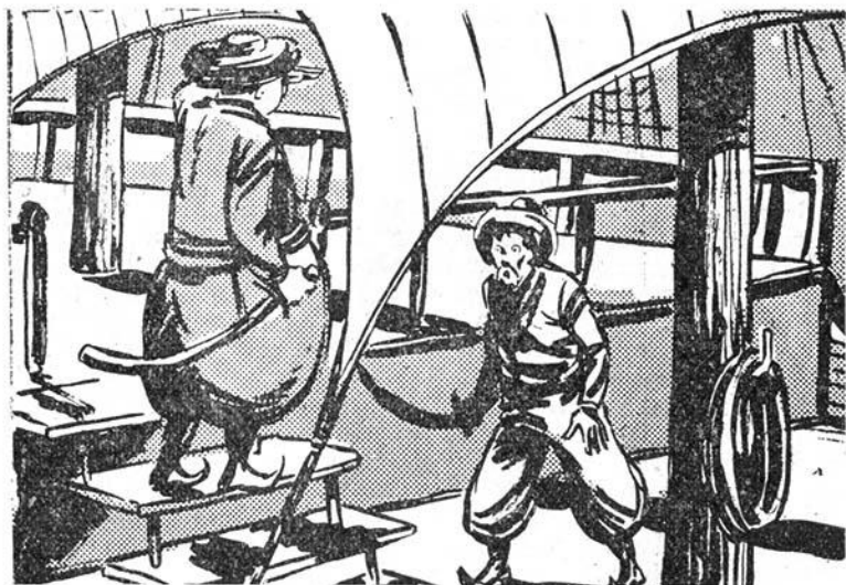
— Εἶμαι ὁ Προφήτης Μωχα μέτρε! λέει ὁ Στραπάτσος.

— Τί τὸν θέλεις καὶ τὸν κουβαλᾷς μαζί σου τὸν ἀρχιλήσταρχο; Γιατί δὲ μ' ἀφήνης νὰ τοῦ ψάλω τὸ «δεῦτε λάβετε τελευταῖον ἀσπασμόν» νὰ ζοιλαφρώσης ἀμέσως;