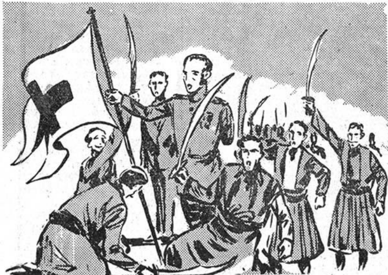
Ἡ ἐπανάστασι ξέσπασε κι' ἔλας. Σὲ λίγο ὁ Ὑψηλάντης θά κατέβη στὸ Μωριά...

Παίρνουν τὸ γράμμα, κάνουν ἕνα βαθὺ τεμενά, προσκυνᾶνε. Λίγο ἀργότερα, μιὰ Βάρκα μετὴ τοὺς τρεῖς κουρσάρους φεύγει ἀπ' τὸ «Οὐέρδα». Σὲ εἴκοσι ὥρες, τὸ πολὺ τὸ γράμμα, πού θά χαρίση τὴ