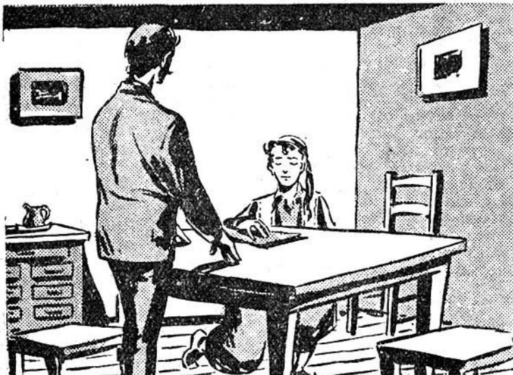
Τὸ Ἑλληνόπουλο δίνει μὲ βαθεῖα συγκίνησι τὸν ὄρκο στὴ Φιλίχῃ Ἐταίρειά.