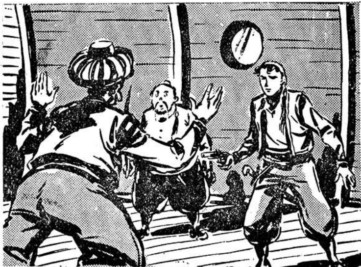
— Που είναι το κορίτσι; ρωτάει άγρια το Έλληνόπουλο.

Μπροστά το τολμηρό Έλληνόπουλο, πίσω ο Στραπά-