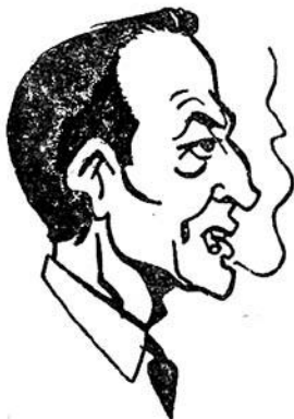
Ὁ Ἀρχηγός Πύμ

— Τζάννερτ, εἶπε. Εἰδοποίησε τὸ ἀμάξι μου νὰ μὲ περιμένῃ κάτω. Καὶ ἔκλεισε.