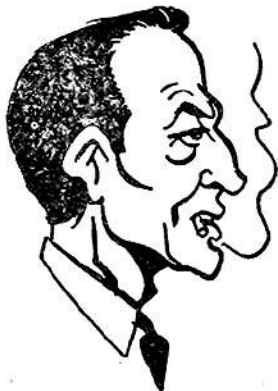
Ό Άρχηγός Πόμ