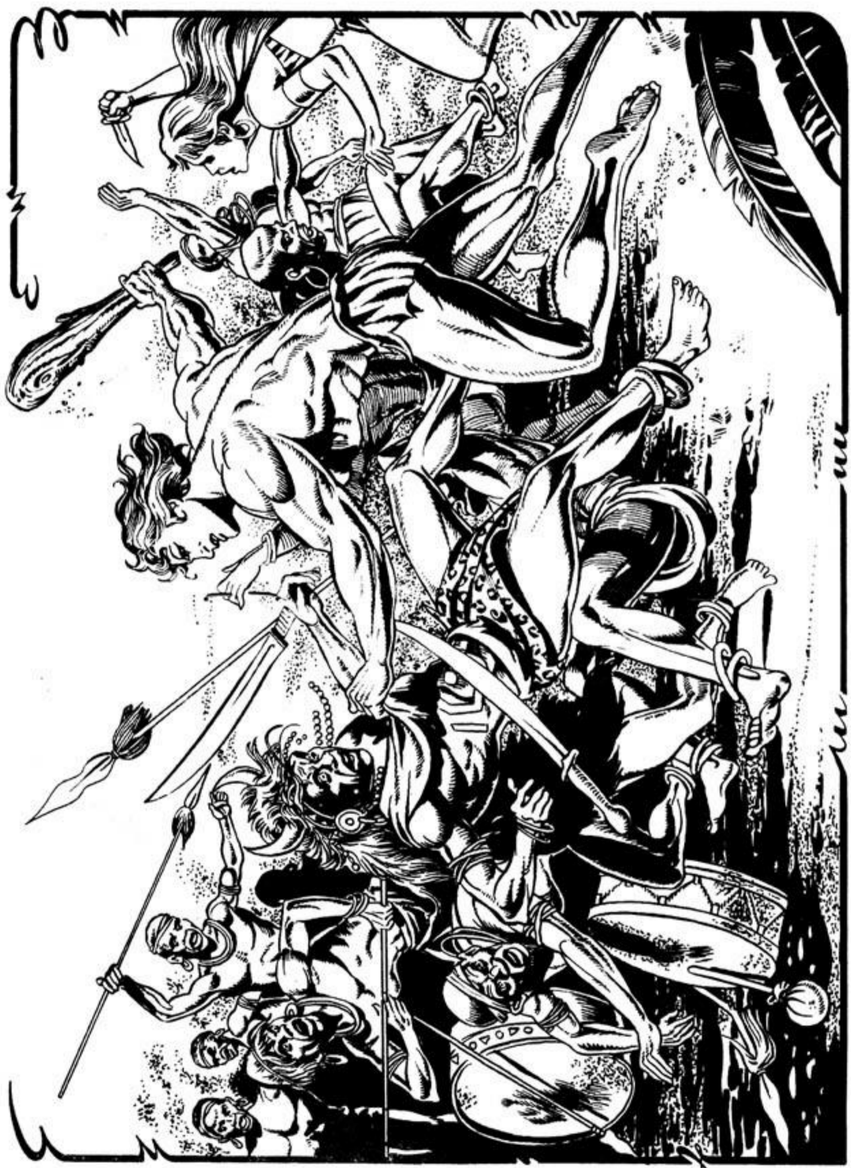
· Ο Γκαούρ με το ρόπαλο. Αυτή με το φονικό μαχαίρι, χτυπούν τώρα τους άνθρωποφάγους.