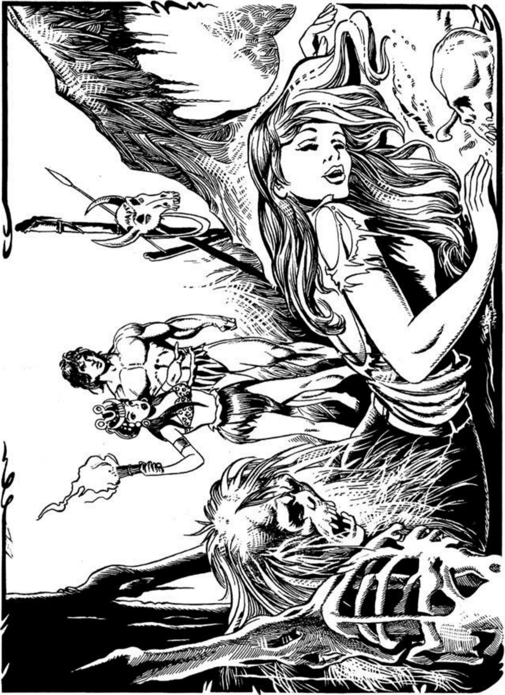
Σε μία γωνιά, σωριασμένο κάτω τó κορμί μίας ζωντανής γυναίκας.