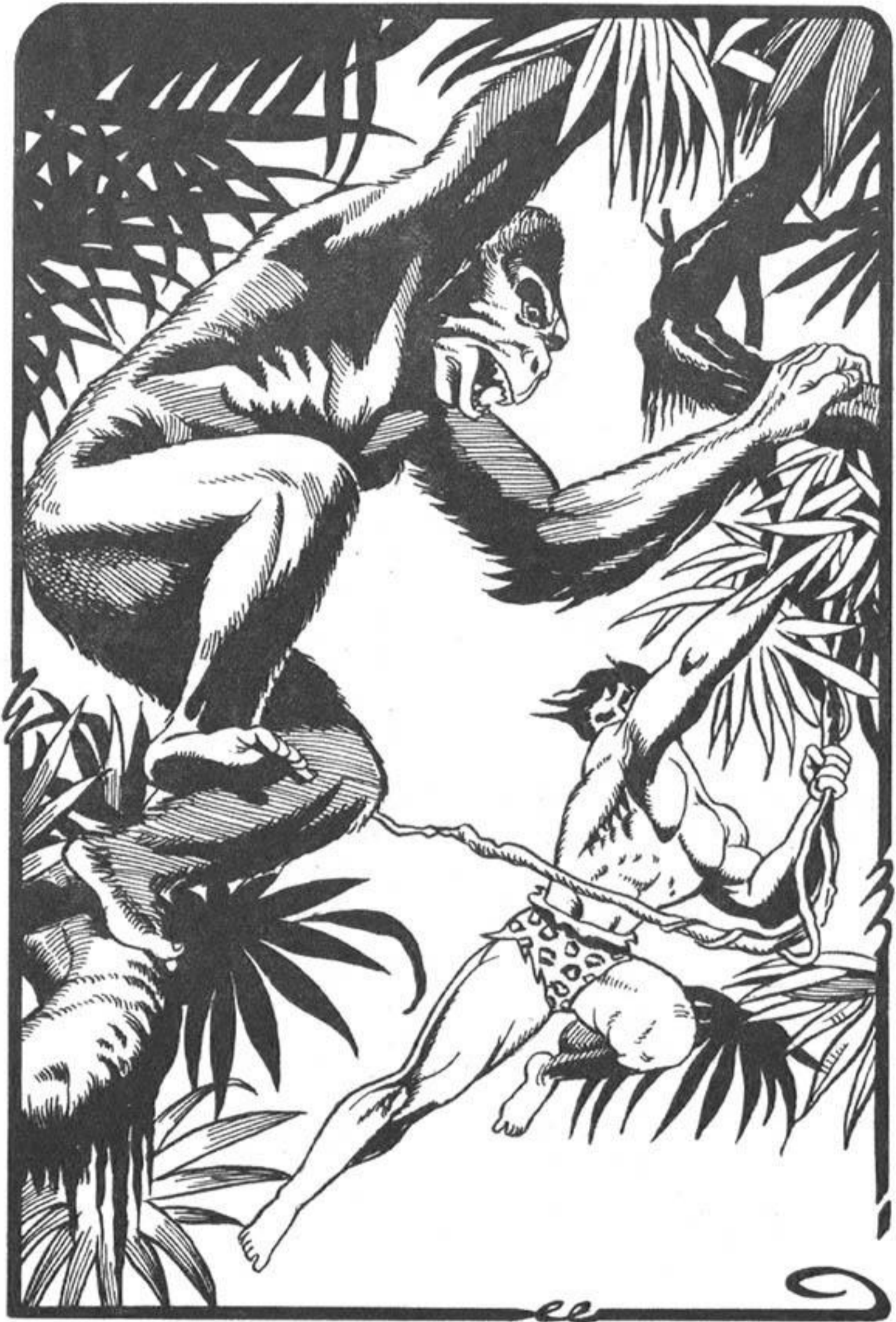
Ο Ναζράτ, πετώντας από κλαδί σέ κλαδί, πλησιάζει τή γορίλαινα.