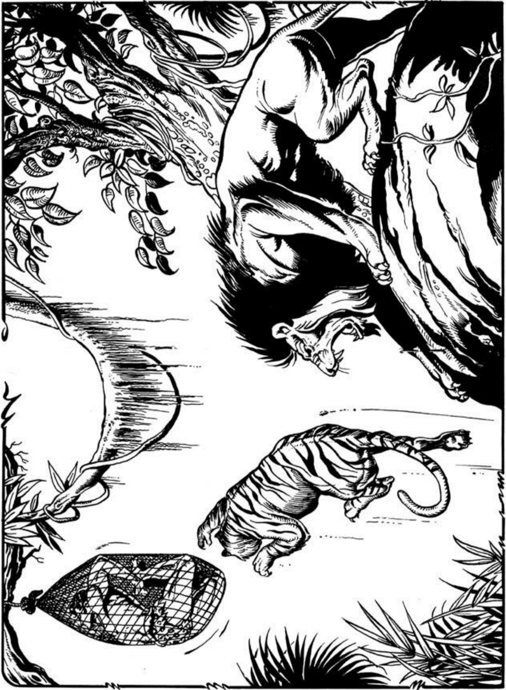
Τά δύο θηρία πηδούν με λύσσα. Πασχίζουν να φτάσουν τό κρεμασμένο θύμα.