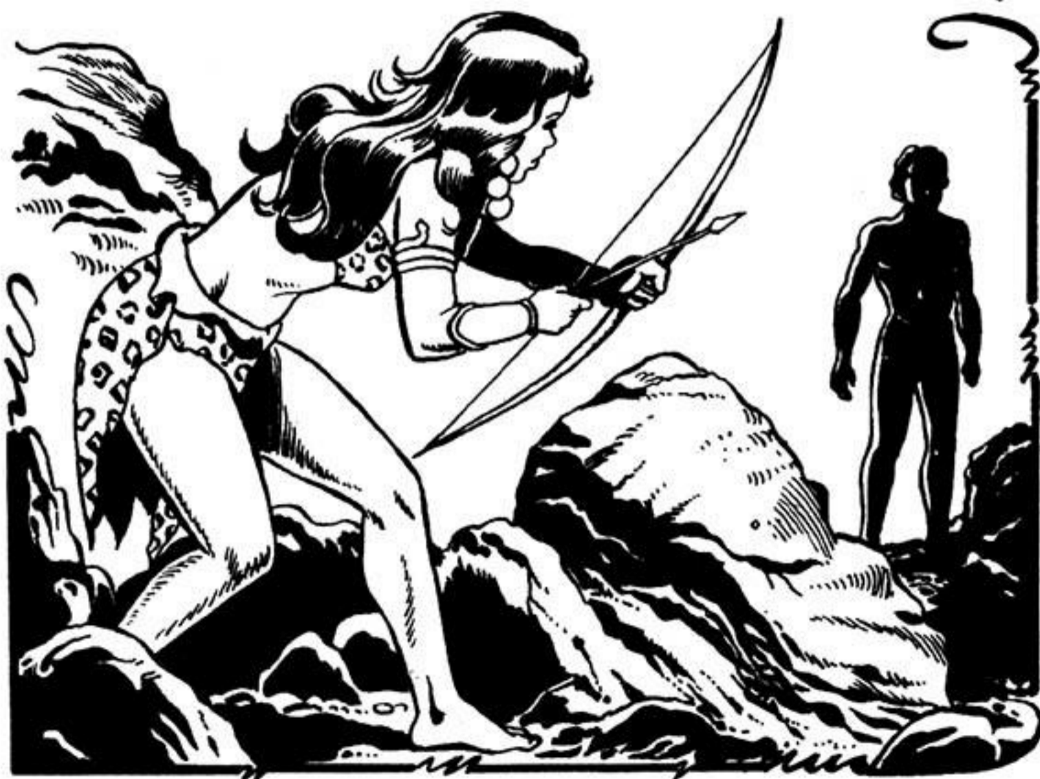
Ἡ ἰθαγενής σημαδεύει μέ τεντωμένο τόξο.