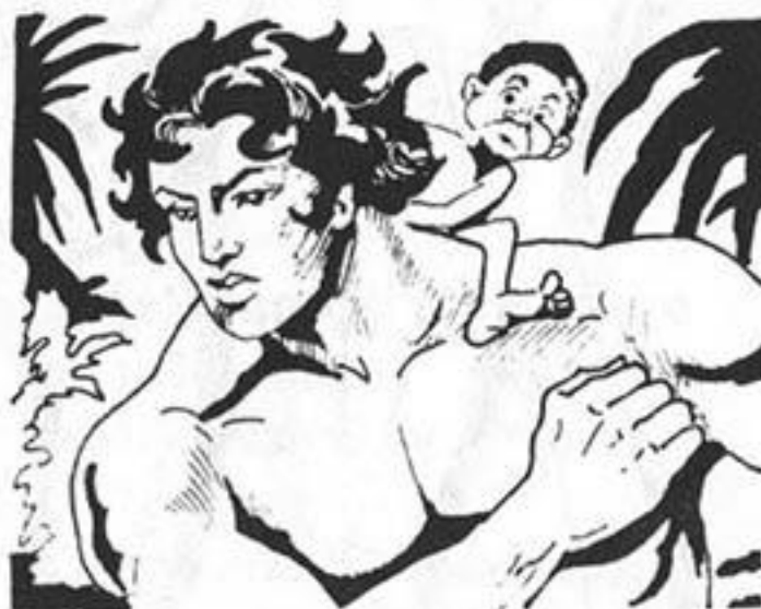
Ὁ Γκαοῦρ τρέχει γιά τό παλάτι τοῦ μαχαραγιά.

– Φτάνει πιά, φωνάζει στούς δῆμιους. Τόν κουράσαμε μέ τά