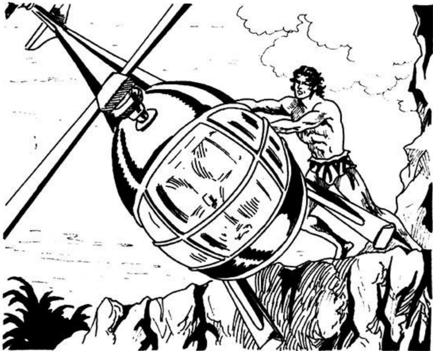
Μέ τήν άφάνταστη δύναμη του τ’ αναποδογυρίζει...

Σιγά-σιγά, χαμηλώνει. Καί γρήγορα κάθεται σέ μικρή άπόσταση