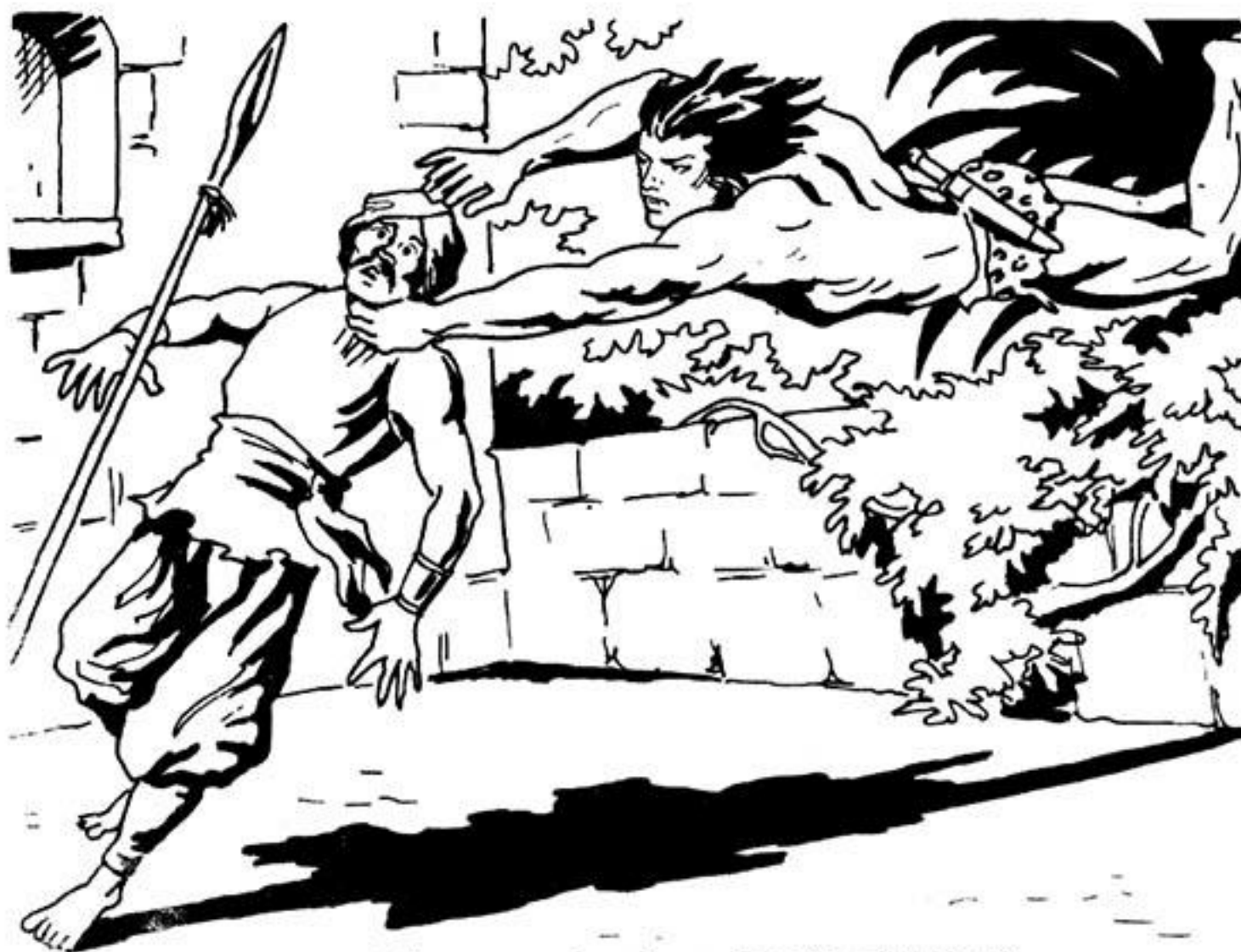
'Ο Ταρζάν, μ' ένα τρομερό πήδημα, άρπάζει τó φρουρό.

- Δέν μπορῶ!... Δέν μπορῶ!... τ' άποκρίνεται ó φύλακας.