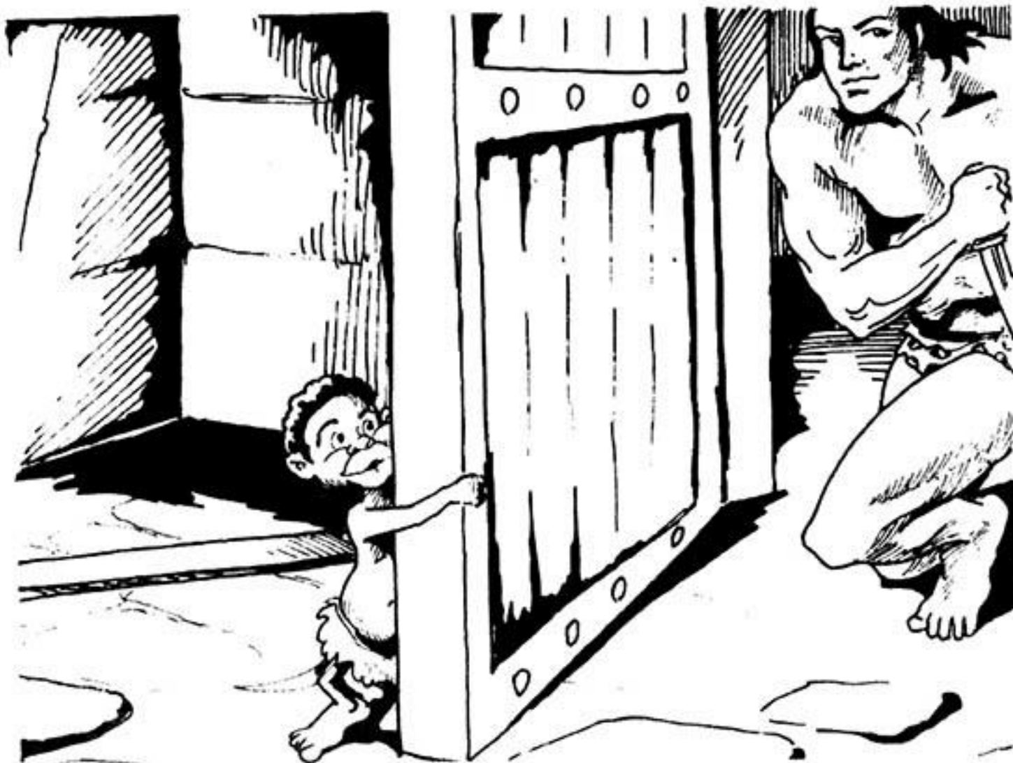
Ὁ νάνος τραβάει μέ δυσκολία τήν ἀμπαρα κι ἀνοίγει τήν πόρτα.