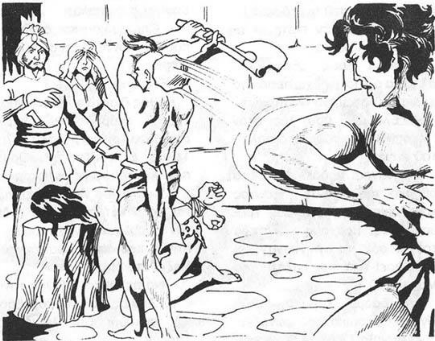
Ὁ Γκαούρ χτυπάει μέ τήν πέτρα τό δῆμιό στο πίσω μέρος του κεφαλιού του.