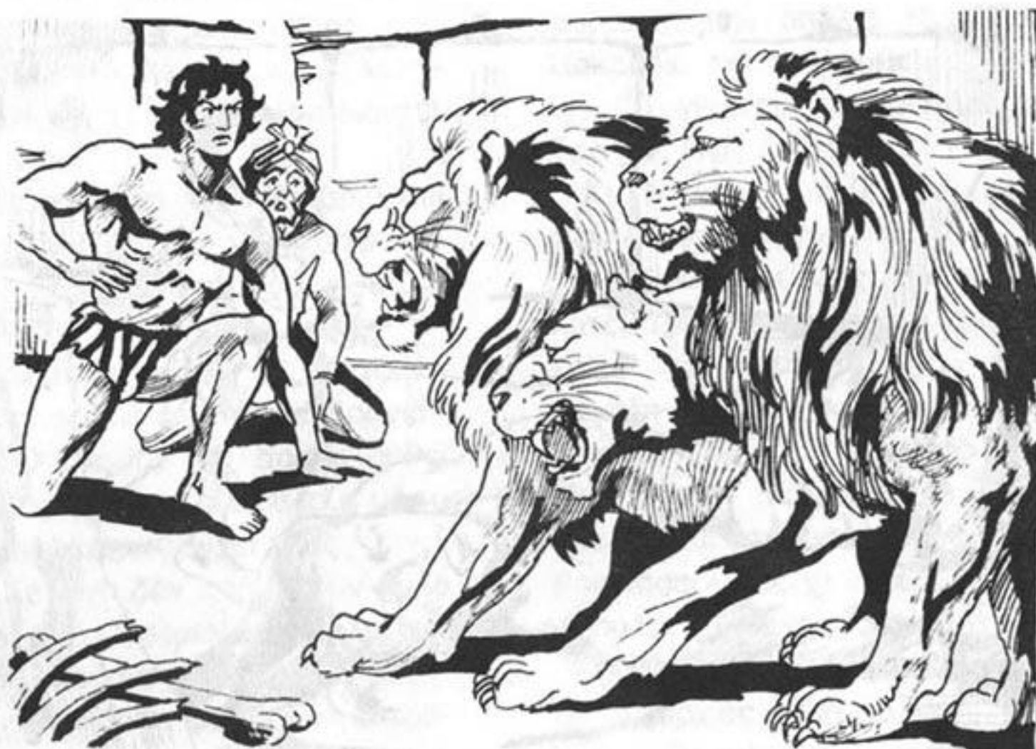
Τοῦς ὑποδέχονται τρία ἀγρια καί πεινασμένα λιοντάρια.