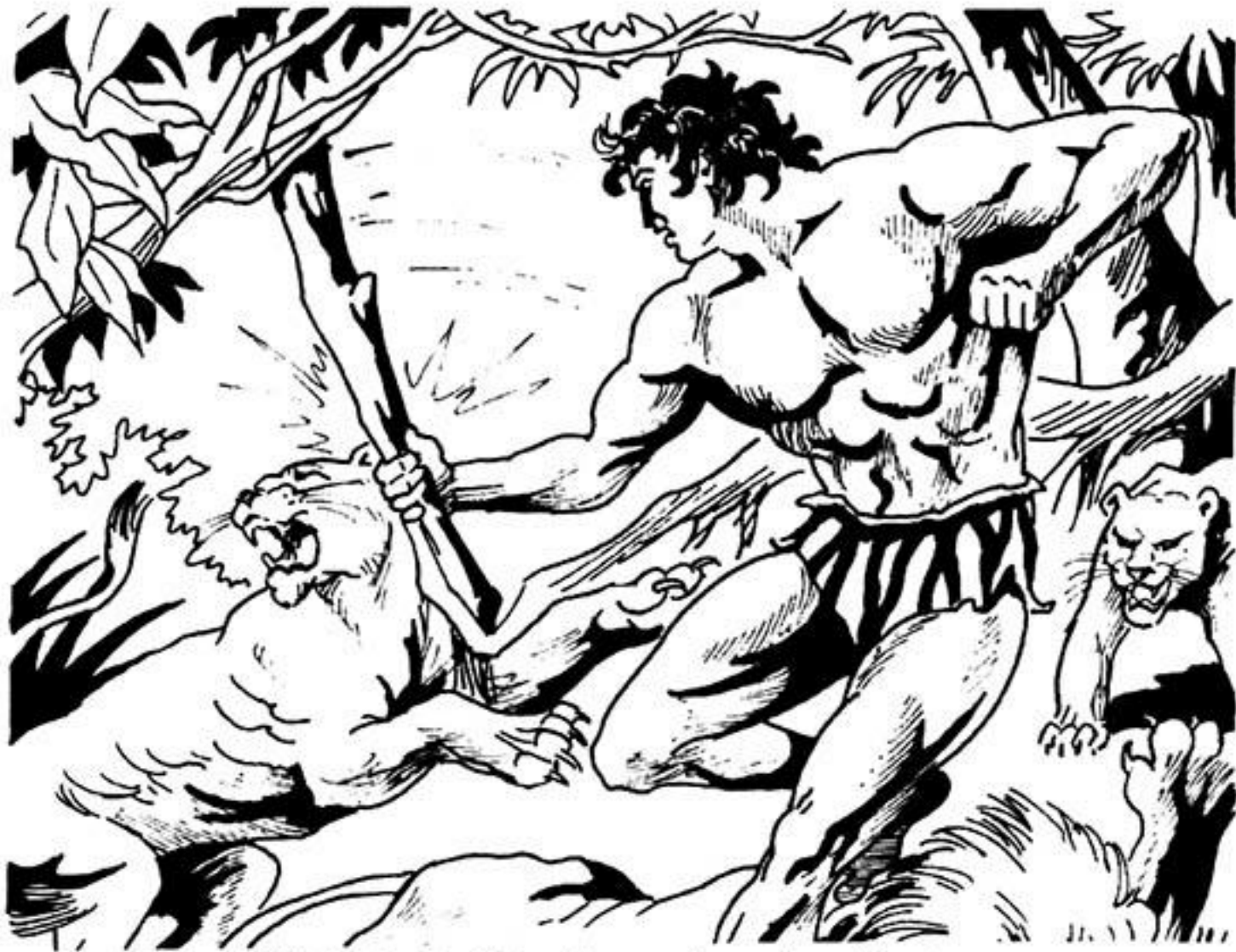
Μέ τό ρόπαλο ὁ Γκαούρ σκοτώνει τά μισά θηρία.

Ὁ Ποκοπικό κουνάει θλιβερά τό κεφάλι του: