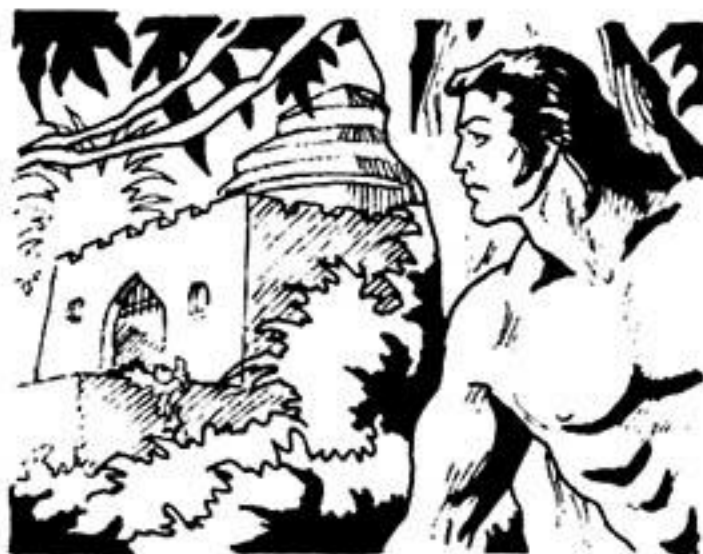
Ὁ Ταρζάν πλησιάζει στό παλάτι τοῦ μαχαργιά.