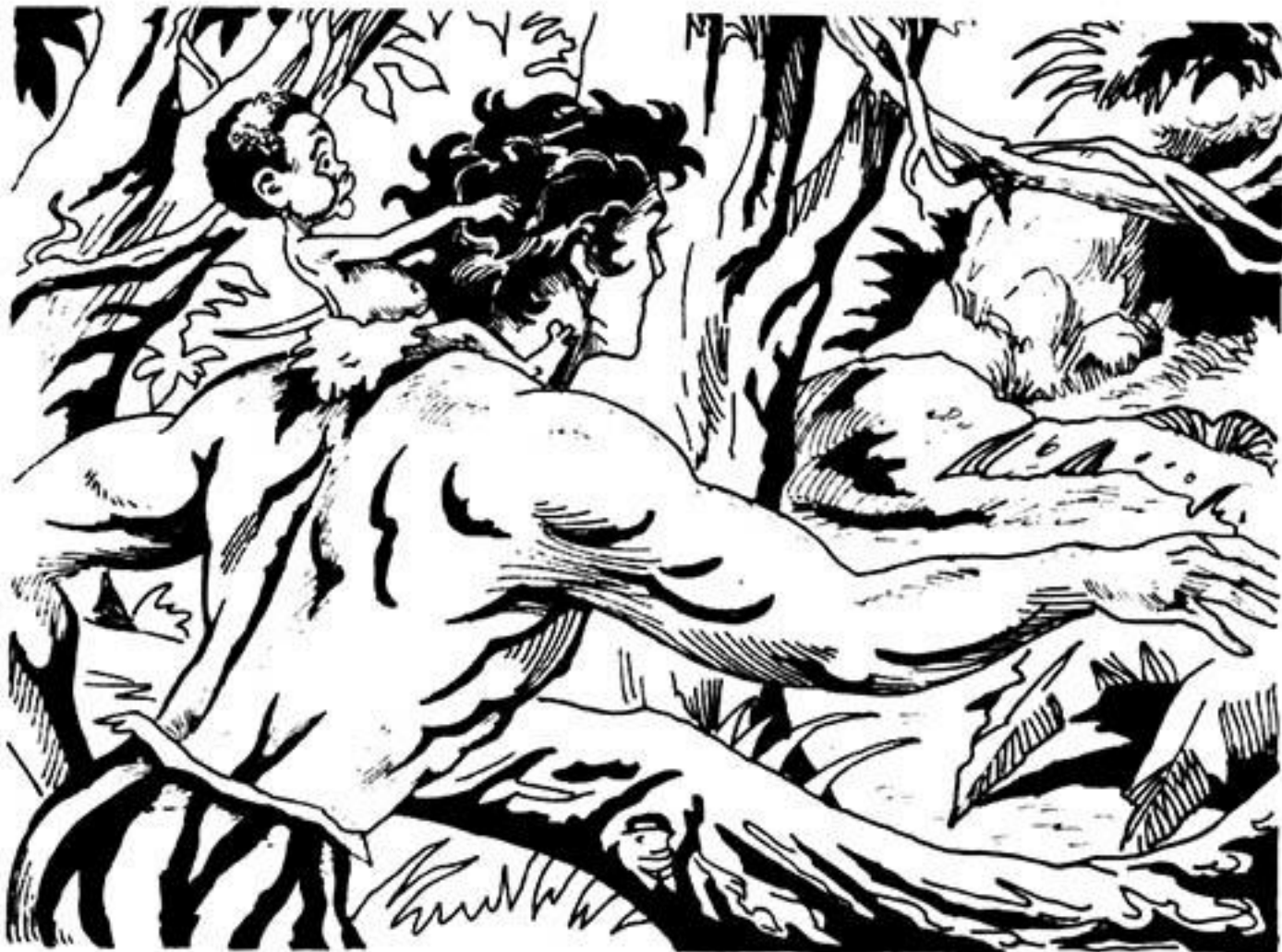
Τρέχοντας, ὁ γίγαντας, φτάνει στή σπηλιά τοῦ Ταρζάν.