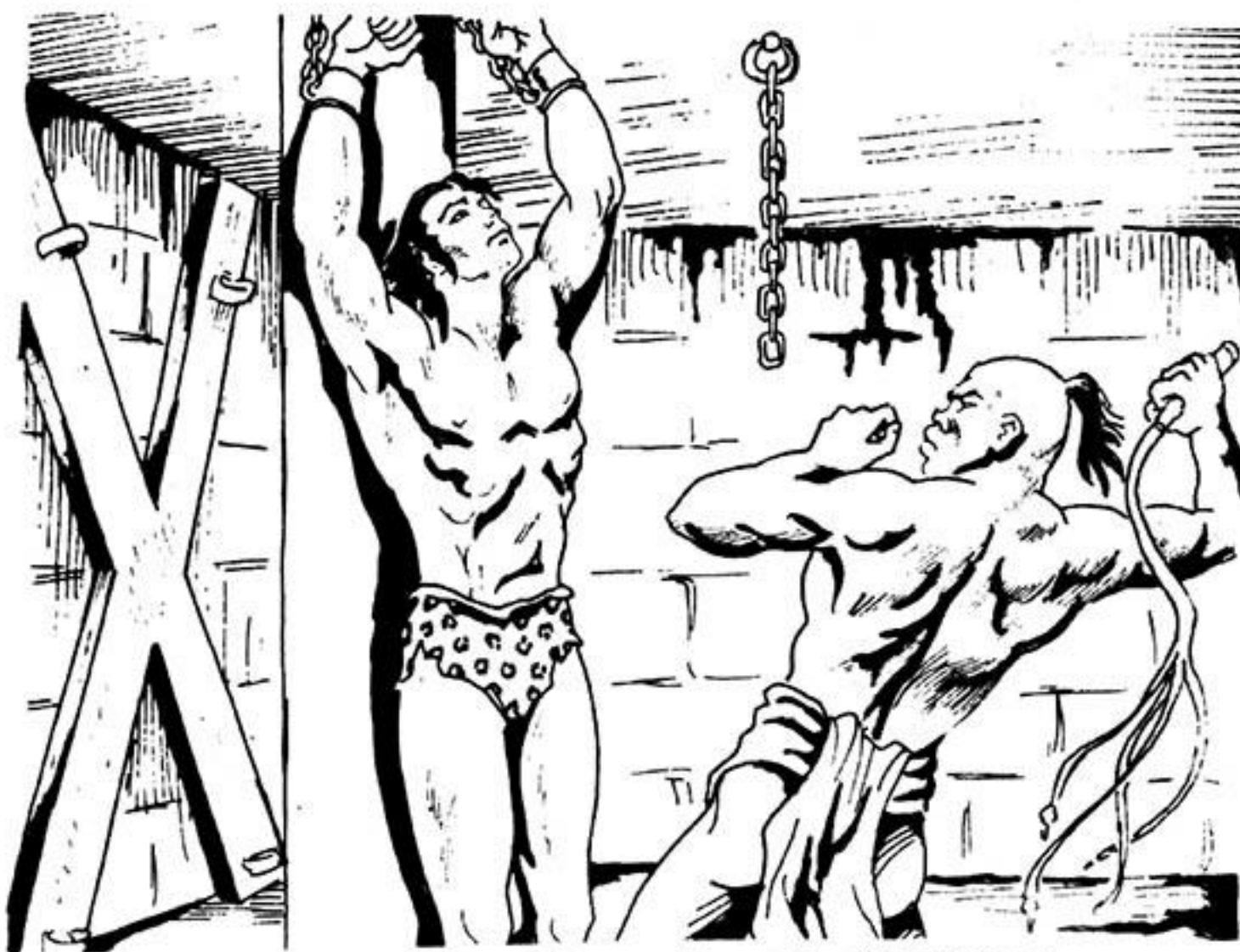
Ο Ταρζάν υποφέρει άκλόνητος τά καινούρια βασανιστήρια

Ο Μαχαραγιάς είχε ξυπνήσει άπ' τά βήματα του Ταρζάν. Βγήκε στό παράθυρό του. Έτσι είδε τούς δύο δραπέτες. Τούς