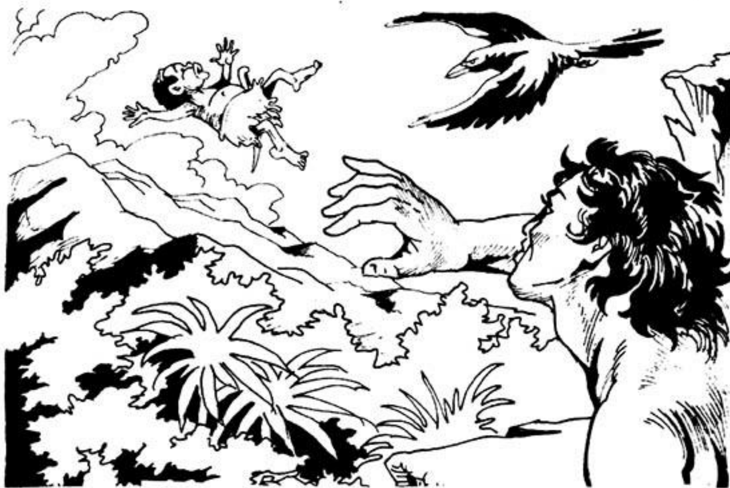
Πετάει τὸ νάνο ψηλά μ' ἀφάνταστη δύναμη.

- Στό ἔχω ξαναπεῖ: τά κουτσομπολιά δέ μ' ἀρέσουνε. Αὐτός κάτι πήγε νά μοῦ πεῖ. Μά τοῦ ἔκοψα τό βήχα. Ἄκου νά σοῦ πῶ, τοῦ λέω. Μήν ξαναπιάσεις στό στόμα σου τό Γκαούρ, γιατί