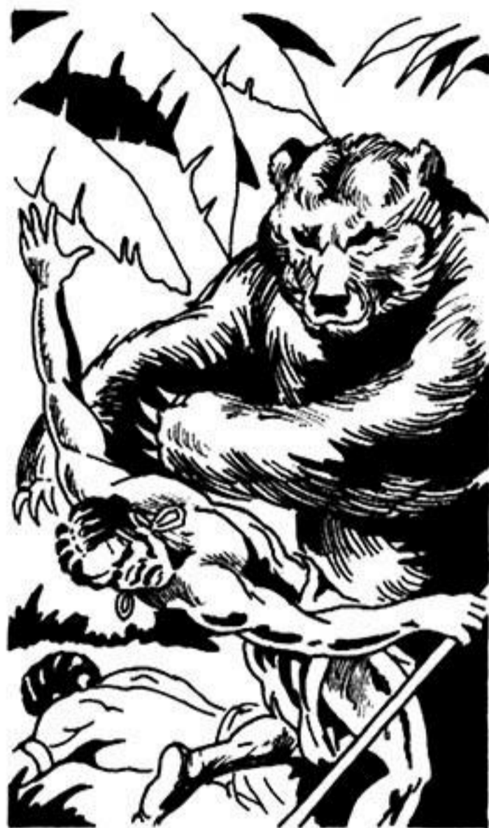
Τούς σκοτώνει ὄλους μ' ἕνα μόνο χτύπημα.

'Ο Θόμπσον κι ἡ Λίμαν κατεβαίνουν ἀπ' τό δέντρο. Δένουν πάλι μέ χορτόσχοινα τόν Ταρζάν.