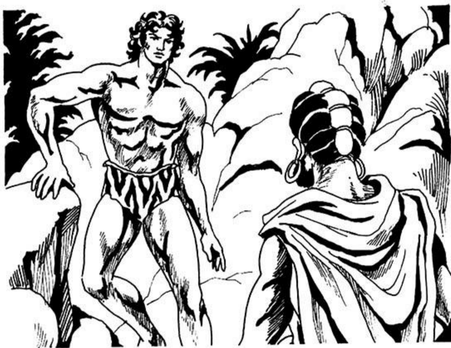
Σέ λίγο ὁ μελαμψὸς γίγαντας φτάνει μπροστὰ στὸ φύλαρχο.