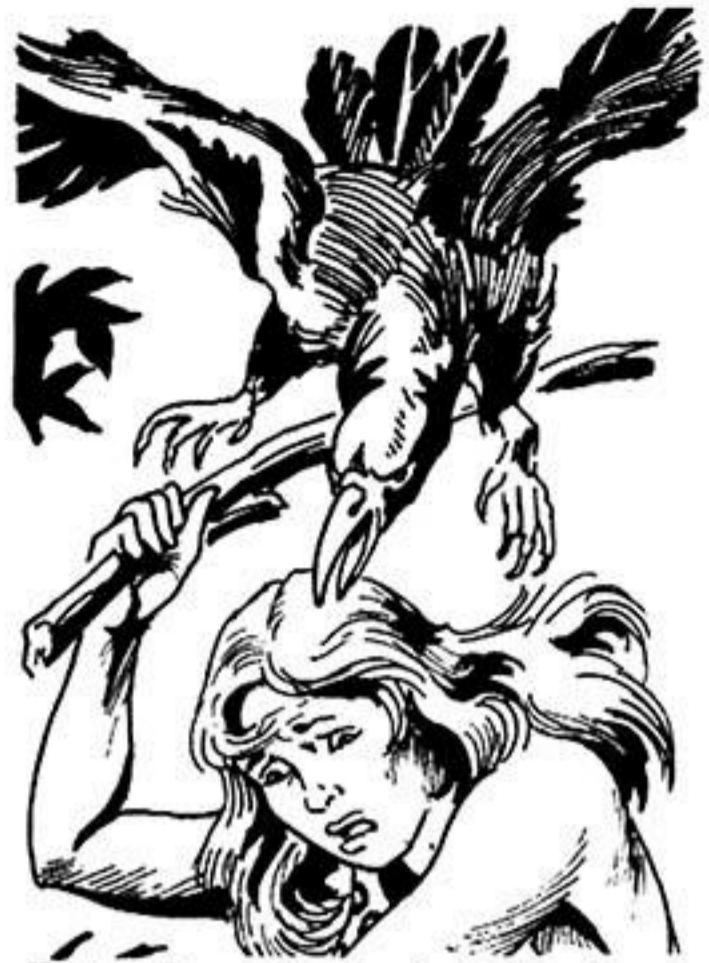
Τή χτυπάει μέ λύσσα μέ τό σκληρό του ράμφος.