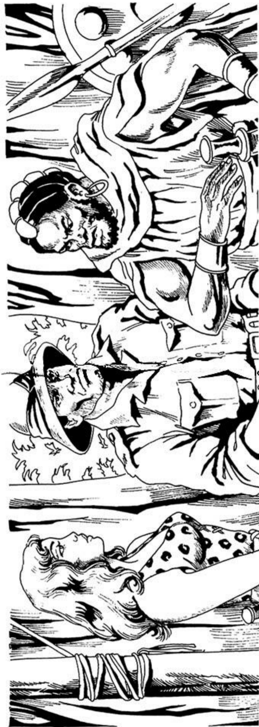
- Ένας μόνον τρόπος υπάρχει για να πετύχει η άποστολή σας.