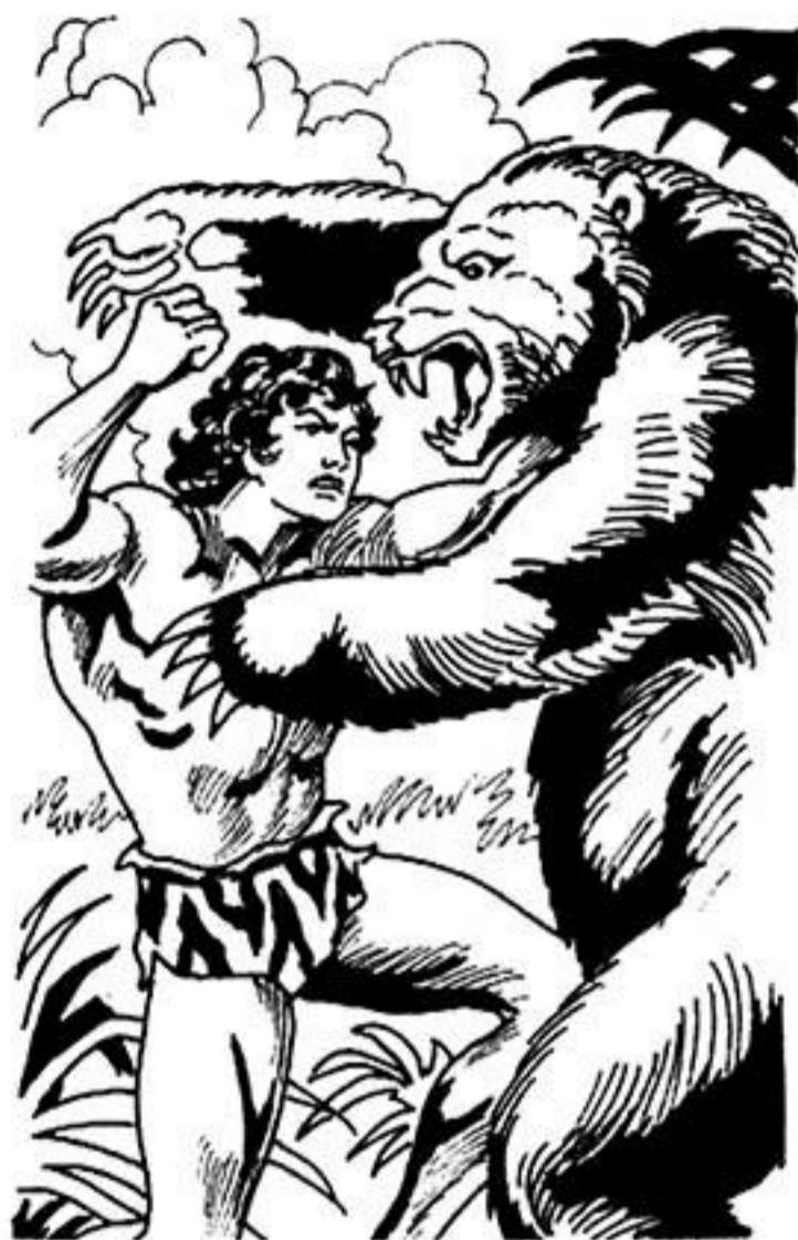
Μιά τρομερή πάλη αρχίζει μεταξύ τους.

Σάν πονηρός άνθρωπος καταλαβαίνει, πώς πρέπει νά τά 'χει καλά μέ τό μαῦρο δαίμονα.