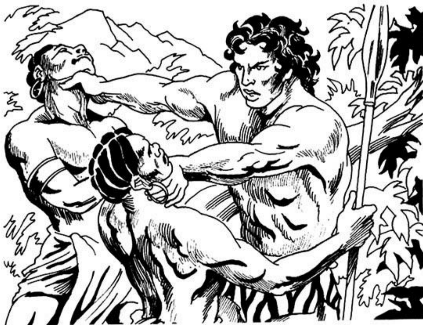
Τούς ἀρπάζει ἀπ' τό λαιμό καί τούς πνίγει.

Ὁ Γκαούρ δέν ἀργεῖ νά συνέλθει. Ὁ Πικ τοῦ δείχνει τό