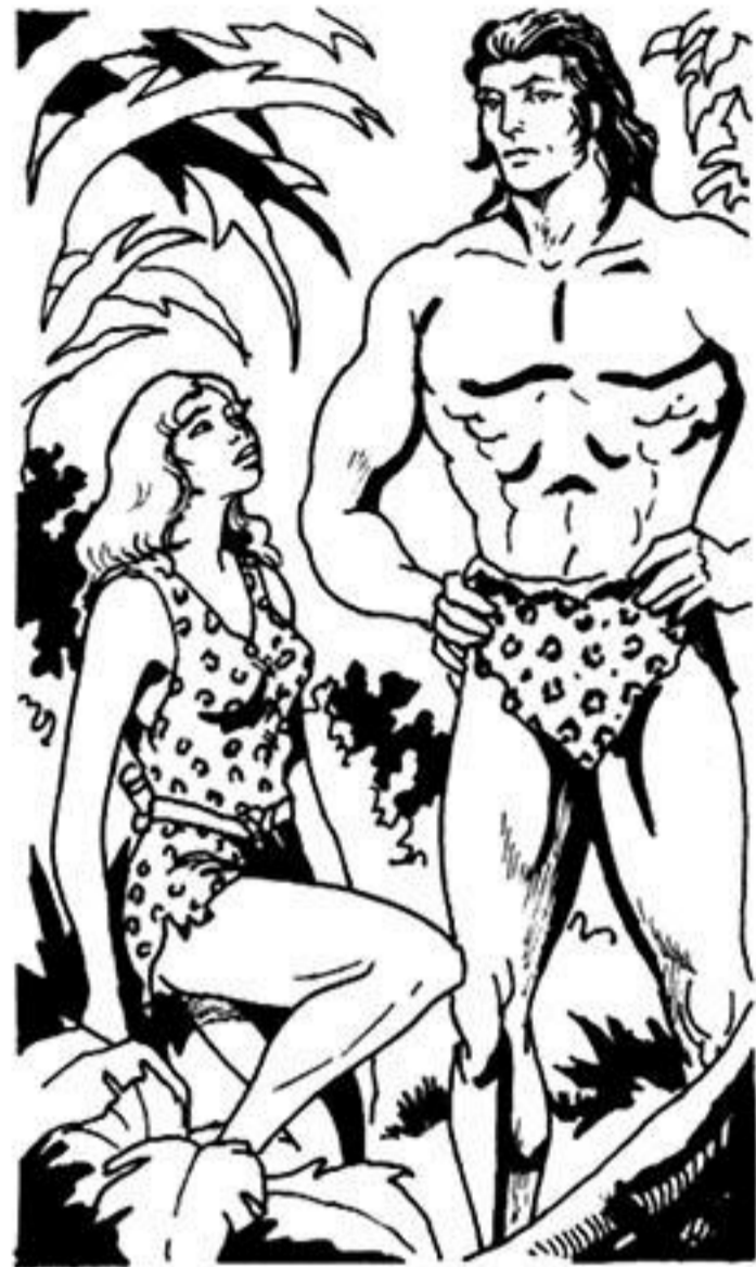
Ἡ ὀμορφὴ Λίμαν γονατίζει μπροστά του.

Καί προχωρεῖ πρῶτος. Πίσω τόν ἀκολουθοῦν ὁ Θόμπσον κι ἡ Λίμαν.