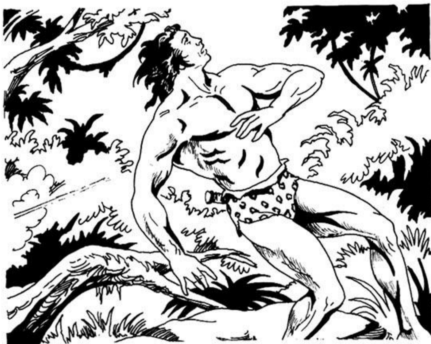
Τό κορμί τοῦ Ταρζάν γέρνει πρὸς τὰ πίσω.