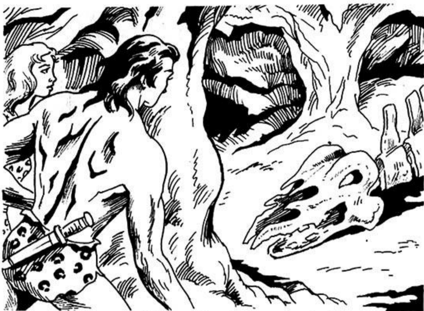
Στό σκοτεινό βάθος φαντάζει κάτασπρος, ο σκελετός.