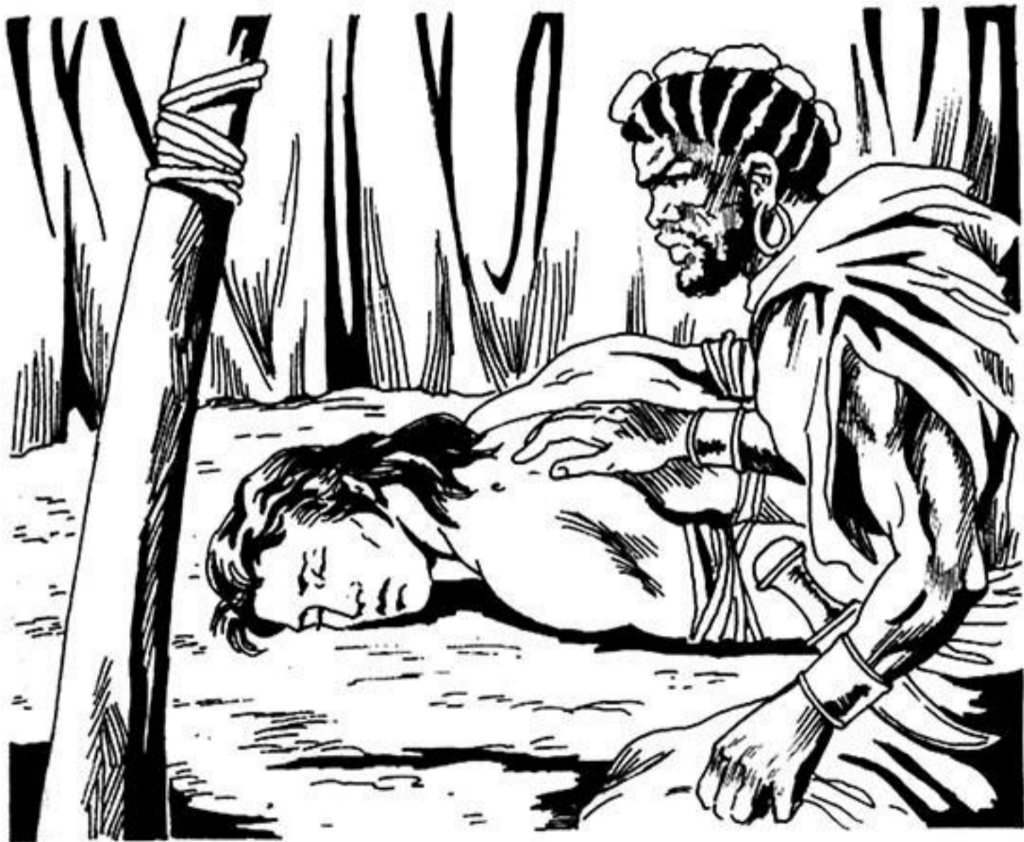
Ὁ φύλαρχος ρίχνει μιά ματιά στήν πληγή τοῦ Ταρζάν.

- Καλά τά καταφέρατε, τούς λέει. Τώρα ἡ δουλειά σας θά τελειώσει. Ἡ μάγισσα θά σώσει τόν Ταρζάν. Ἐτσι, θά μπορέσω νά τόν παραδώσω στόν Γκαούρ.