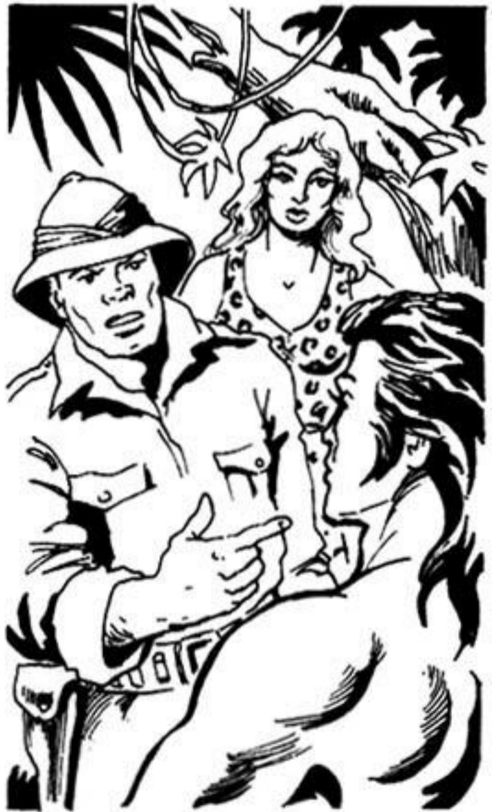
Έκεί μέσα βρίσκεται ό σκελετός ενός δεινόσαυρου.

Μά βρίσκεται σέ τραγική θέση. Ένα τεράστιο φίδι τήν έχει