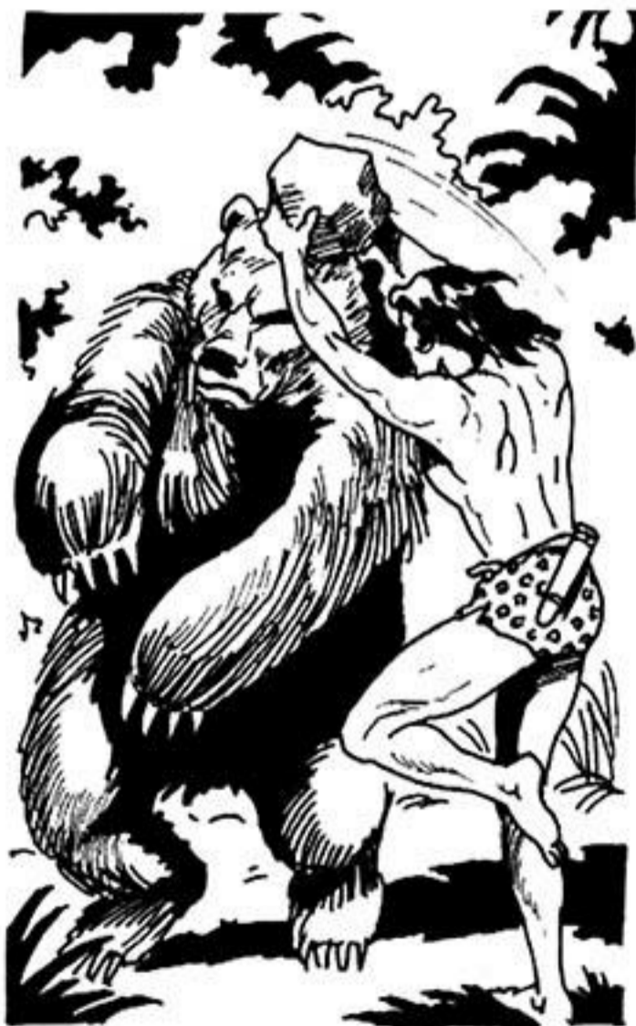
Ἡ Ὁ Ταρζάν χτυπᾷ μέ μιὰ μεγάλη πέτρα τό θειρό.

Ἡ γιγαντόσωμη ἀρκούδα παρατάει τόν Γκαούρ. Στριφογυρίζει μανιασμένη. Οὐρλιάζει ἀπαίσια... Ὁ μελαψός ἄντρας παραξενεύεται. Δέν ξέρει πώς ὁ Πίκ τήν τύφλωσε. Βρίσκει ὁμως τήν εὐκαιρία ν' ἀρπάξει μιὰ πέτρα. Τῆς τήν πετάει μέ δύναμη στό κεφάλι. Ἡ ἀρκούδα σωριάζεται κάτω νεκρή.