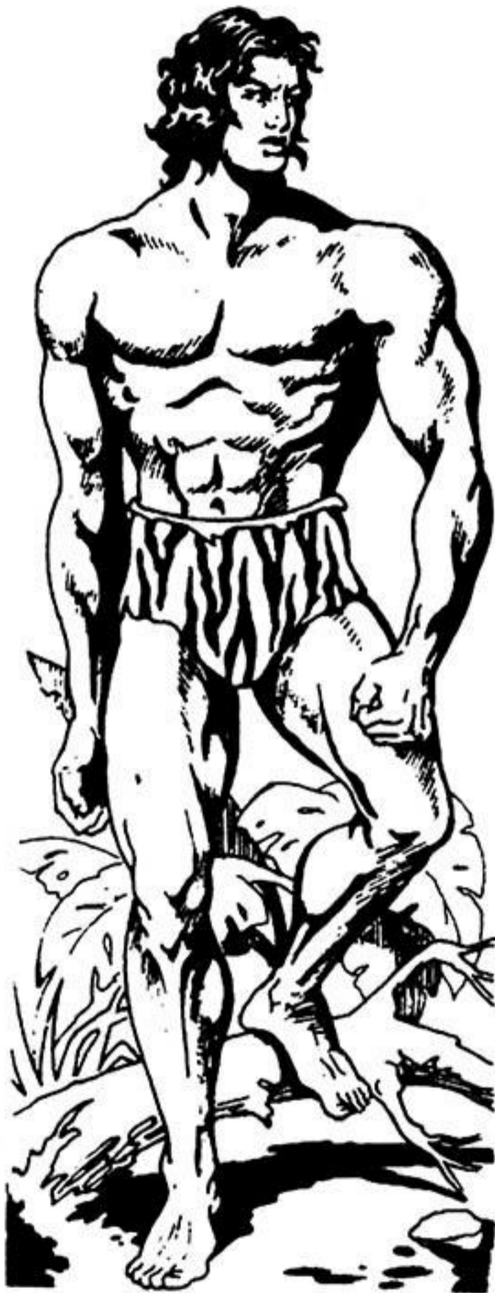
Ο μελαψός γίγαντας

Λίγα λόγια για τό τεύχος Νο 8 τής σειράς ΓΚΑΟΥΡ - ΤΑΡΖΑΝ