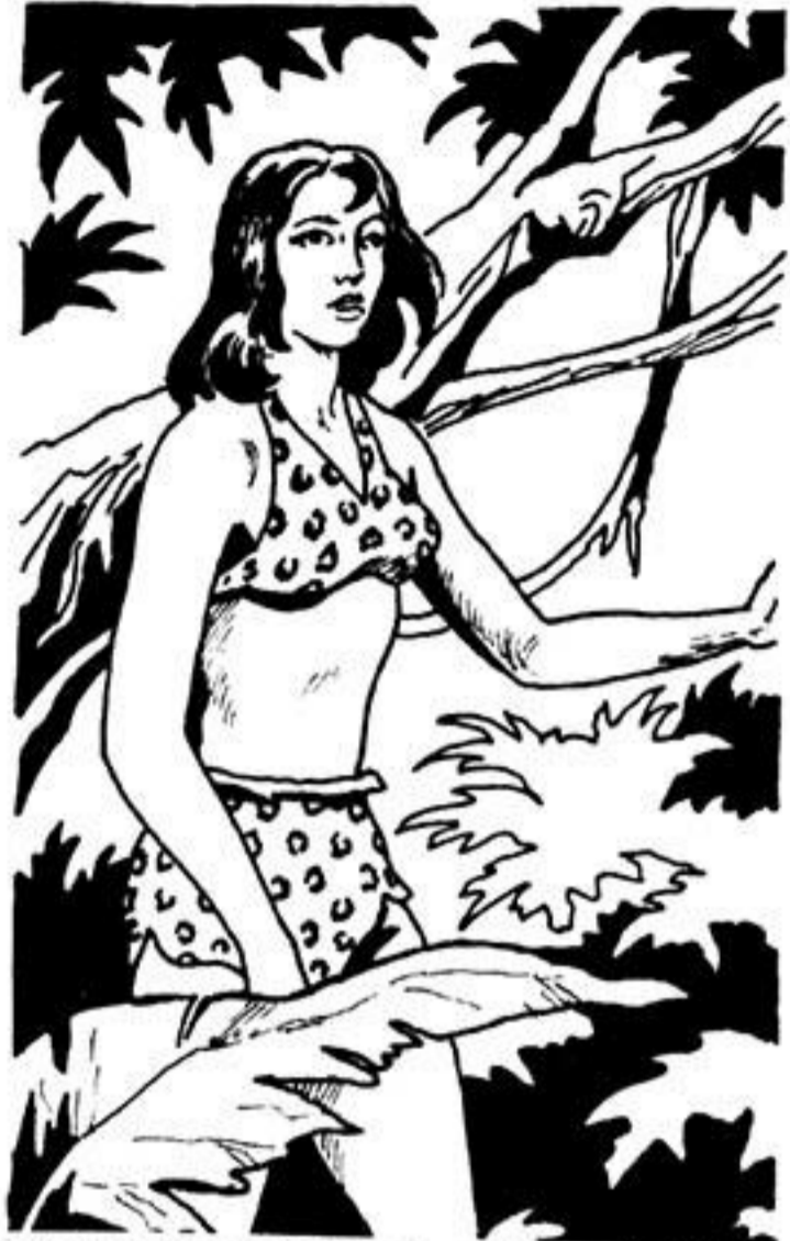
Ο Γκαούρ σκότωσε τό γορίλα καί μ' ἔσωσε.

Τήν ἄλλη μέρα, ὁ ἄρχοντας τῆς Ζούγκλας ξυπνάει καί ἡ Νούσα ἔχει ἐξαφανιστεῖ.