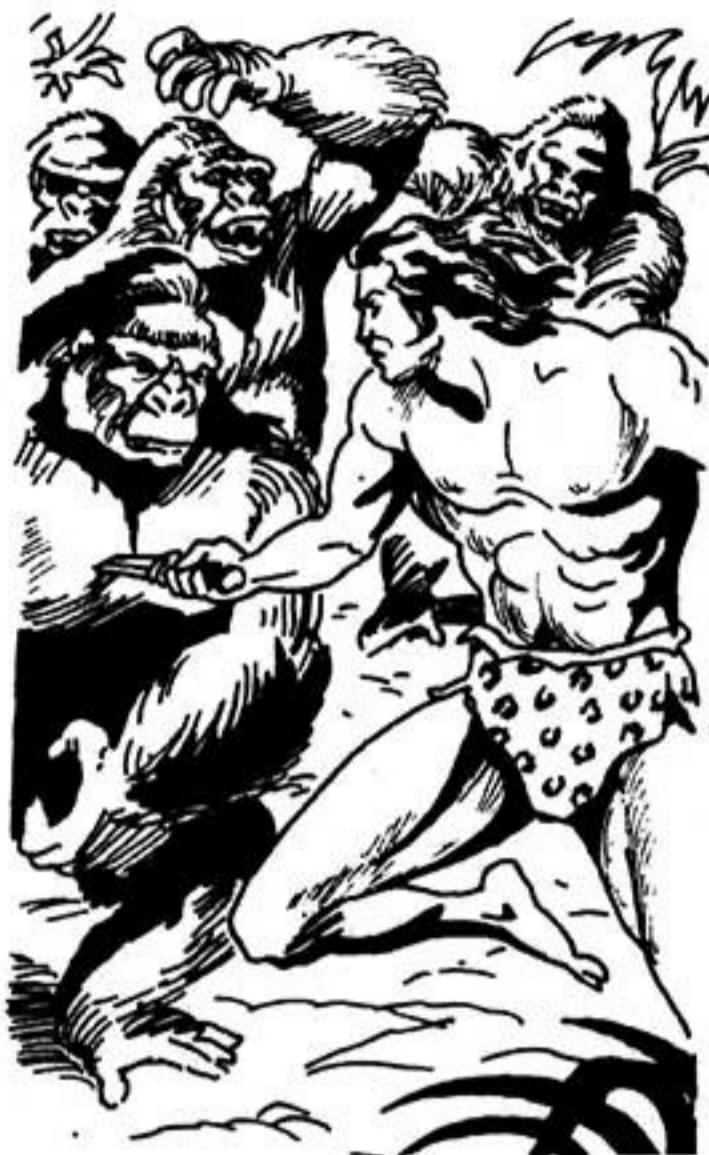
Ό Ταρζάν καρφώνει τό μαχαίρι του στά στήθια τους.

Θά ναι περασμένα μεσάνυχτα. Οί δυό κοιμισμένοι ξυπνοϋν άπότομα. Πετάγονται όρθοί στή σπηλιά.