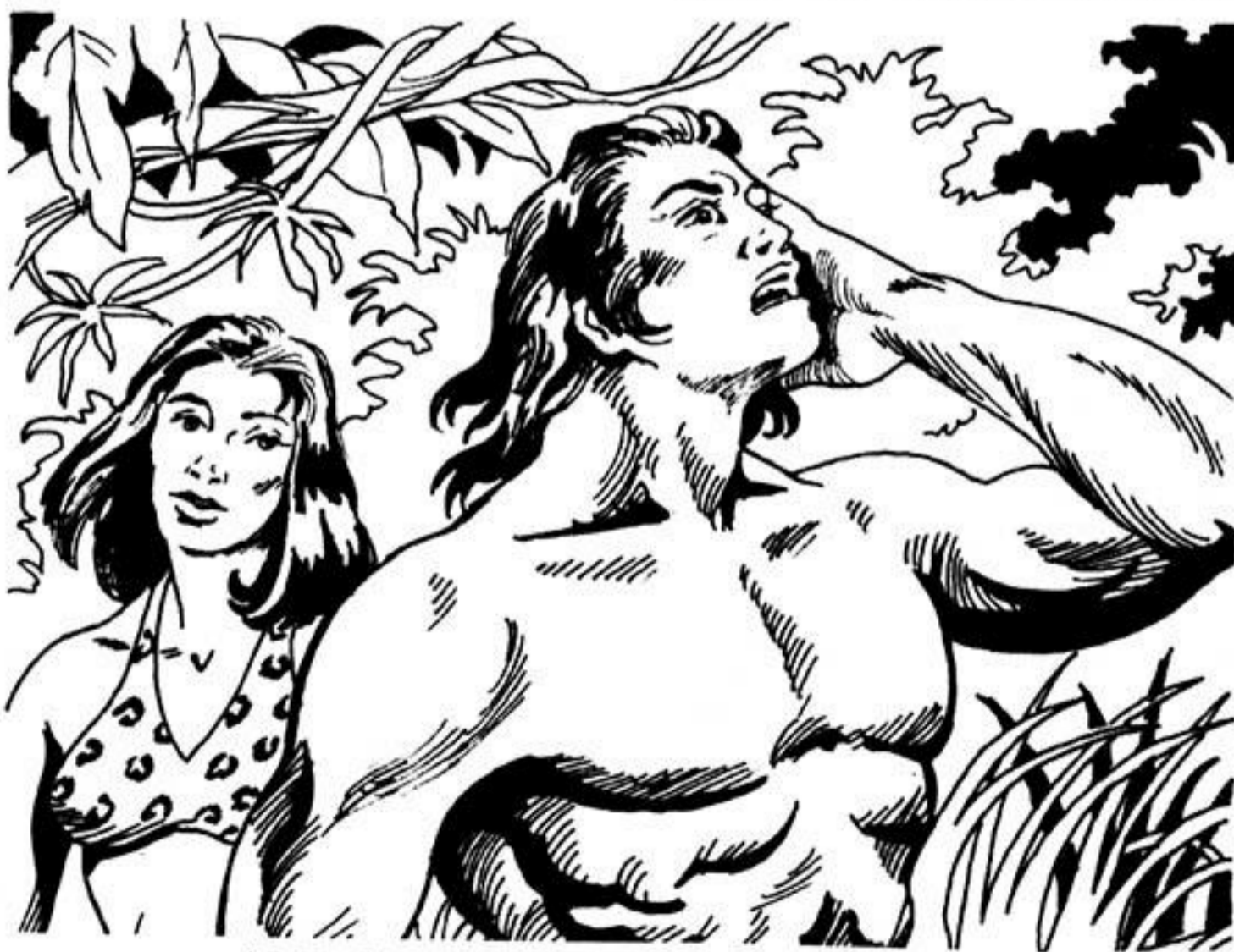
Ή Ταρζάν βγάζει τότε τήν τρομερή κραυγή του.

Καί πίσω του ή Βάτ, ή τετραπέρατη μαιμουδίτσα. Ή άρχοντας τής Ζούγκλας κι ή συντροφισσά του σκαρφαλώνουν στή