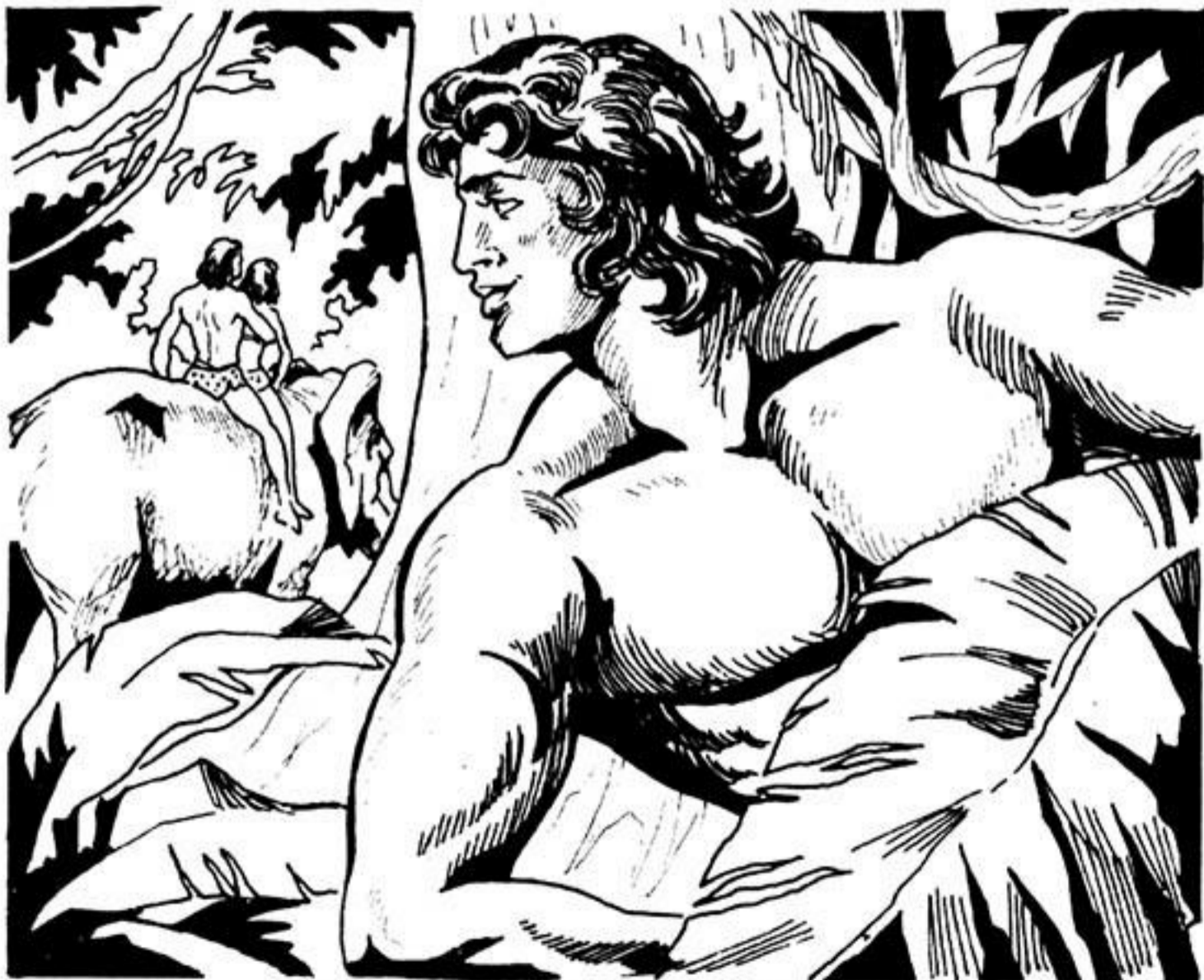
Ο Γκαούρ γελάει εύχαριστημένος. Έχει κάνει τό καθήκον του.

'Ο Γκαούρ φοράει τώρα τό τομάρι του γιγαντόσωμου θεριού. Δέ θέλει νά τόν άναγνωρίσει ή συντρόφισσα του Ταρζάν.