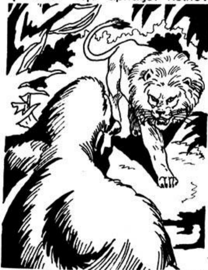
Ὁ Γκαούρ, ντυμένος γορίλας, ἐπιτίθεται στό λιοντάρι

Ἔτσι, προτιμᾶει νά μπεῖ στή σπηλιά. Θέλει νά σώσει τή λευκή γυναίκα. Τήν ἄρπάζει λοιπόν