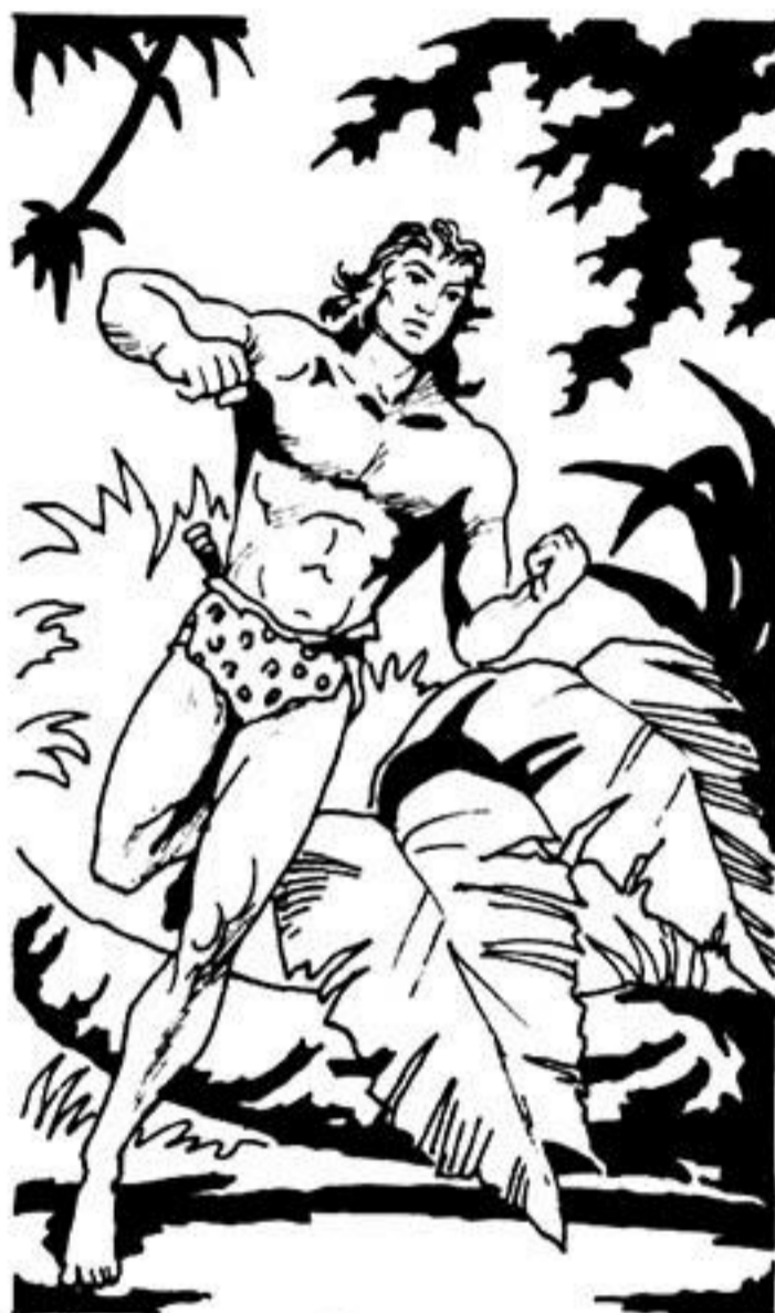
Ο άρχοντας τής ζούγκλας τρέχει ξοπίσω ψάχνοντας.

Πρέπει νά πετάξουμε μέ τή φαντασία μας στό γιγαντόσωμο γορίλα. Νά δοῦμε τί έκανε τή