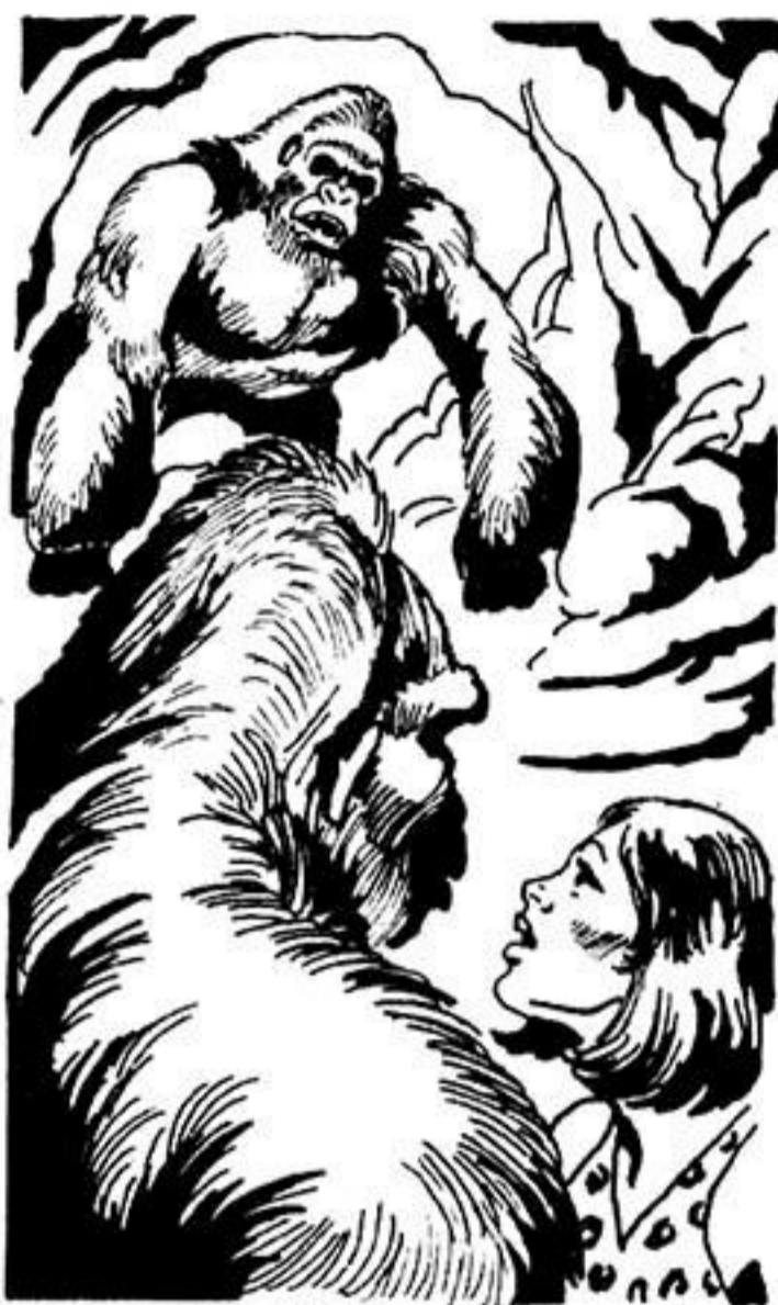
Μέσα μπαίνει μιά έξαγριωμένη γορίλαινα.