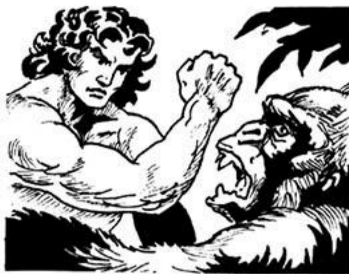
'Ο Γκαούρ παλεύει τότε μέ τό γορίλα.

'Ο Ταρζάν, όπως ξέρουμε, κοιμόταν μέ τή συντρόφισσά του στη σπηλιά. Ξαφνικά, άκούει ούρλιαχτό γορίλα. Νομίζει πώς είναι ο Γκαούρ. Και βγαίνει νά