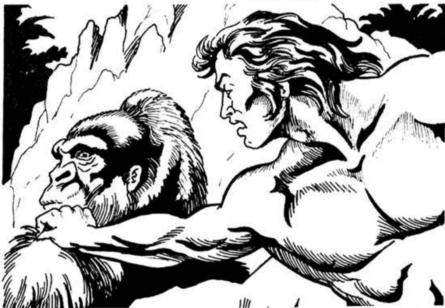
Πιάνει γερά τό γορίλα άπό τό τριχωτό τομάρι τών ώμων του.

Τό μυαλό του λευκού άντρα θολώνει. Κοντοστέκεται άναποφάσιτος. "Υστερα, παρατάει τή Νούσα. Καί τρέχει κυνηγώντας τό γορίλα.