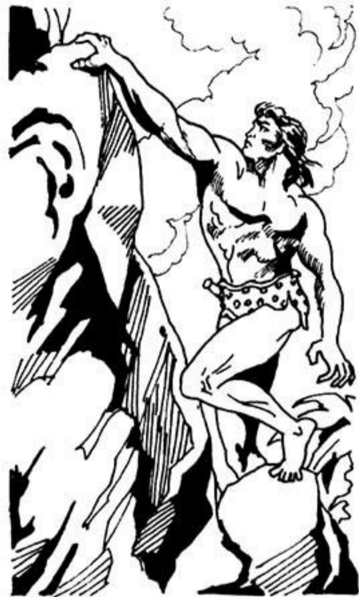
Ἄ Ο Ταρζάν σκαρφαλώνει πάνω στά ἀπόκρημνα βράχια.

καθώς ἀνεβαίνει. Ἦρθες καί μ' ἄρπαξες τή συντρόφισσά μου. Ἔρχομαι κι ἐγώ νά καρφώσω τό μαχαίρι μου στήν καρδιά σου!