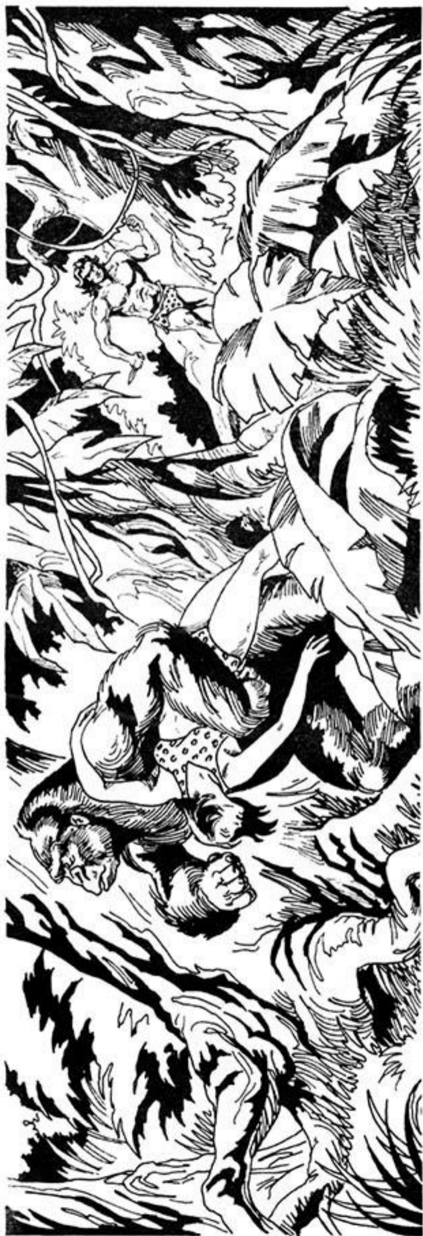
‘Ο Ταρζάν τρέχει πίσω απ’ τό γορίλα.