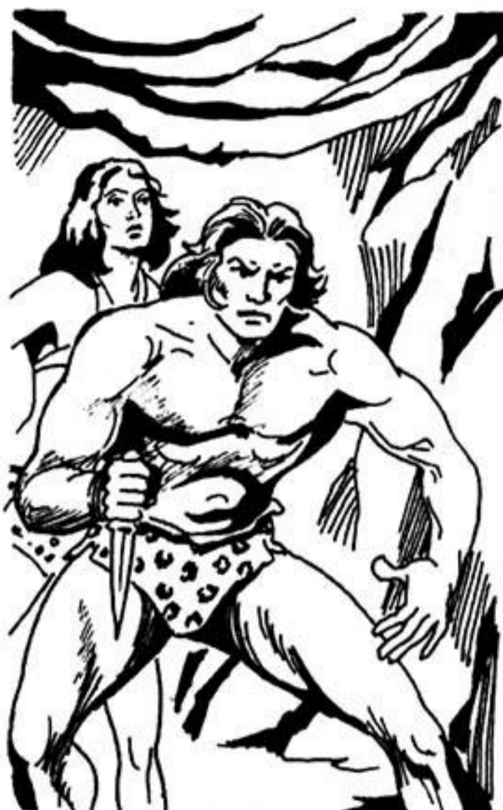
Τρομερά ούρλιαχτά από γορίλες, τούς ξαφνιάζουν.

- Καί πώς, άφοϋ τόν σπάραξε παρουσιάστηκε μπροστά του, γερός καί δυνατός;